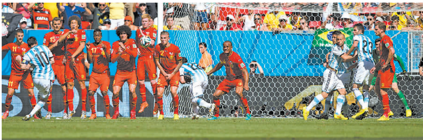
7月5日，阿根廷队球员梅西(左前)在比赛中主罚任意球。(新华社发)