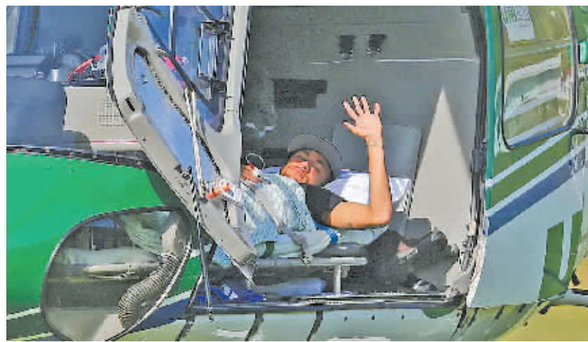
7月5日，内马尔躺在直升飞机上向送行者挥手。

据新华社电(记者刘隆 公兵 姬烨)在内马尔确定因伤告别世界杯后的第二天，巴西国家队队医若泽·路易斯·洪戈在巴西国家队位于里约州特雷索波利斯的大本营召开新闻发布会，披露了前一日医疗组抵达受伤现场时的情况并表示内马尔存在借助护具现场观看半决赛的可能。