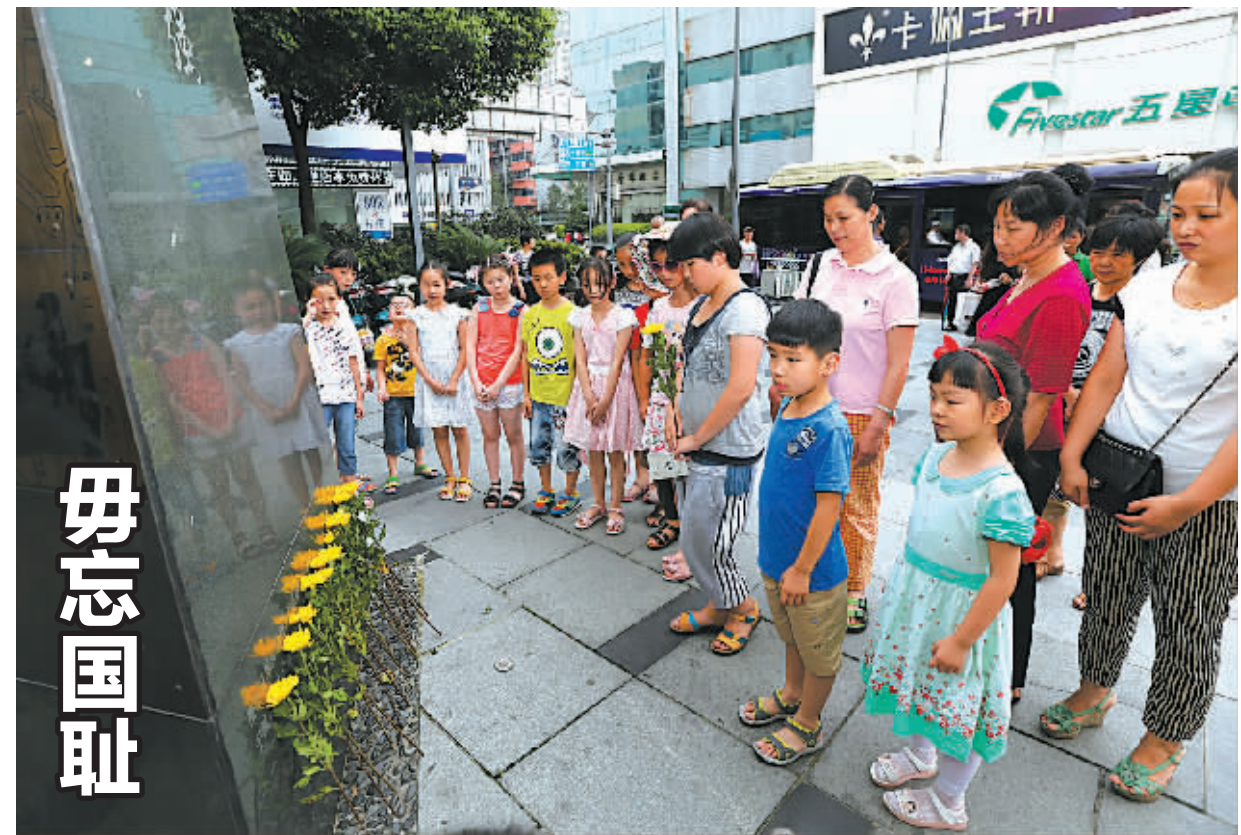
昨日下午，海曙区江厦街道新街社区开展纪念“七七事变”77周年活动，组织辖区青少年代表在海曙区开明街举行日军鼠疫细菌战遗址纪念碑祭奠缅怀遇难同胞。

沈医生表示，痛风重在预防。因啤酒和海鲜都含有大量嘌呤，嘌呤在体内代谢会产生尿酸，血液中异常增高的尿酸无法排出体外而积聚，这就是导致痛风的病理基础。沈医生建议高尿酸患者应少吃高嘌呤食物，如海鲜、动物内脏、火锅等，少饮或不饮酒；辅以适当的体育锻炼。