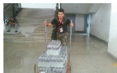
@ 学要倩倩:那居然是脚,而且开在高速上。

@ 江东志愿服务青春微博:今天是家博会展览的最后一天,志愿者们依然没有松懈,他们用坚持书写着当代大学生的风采。