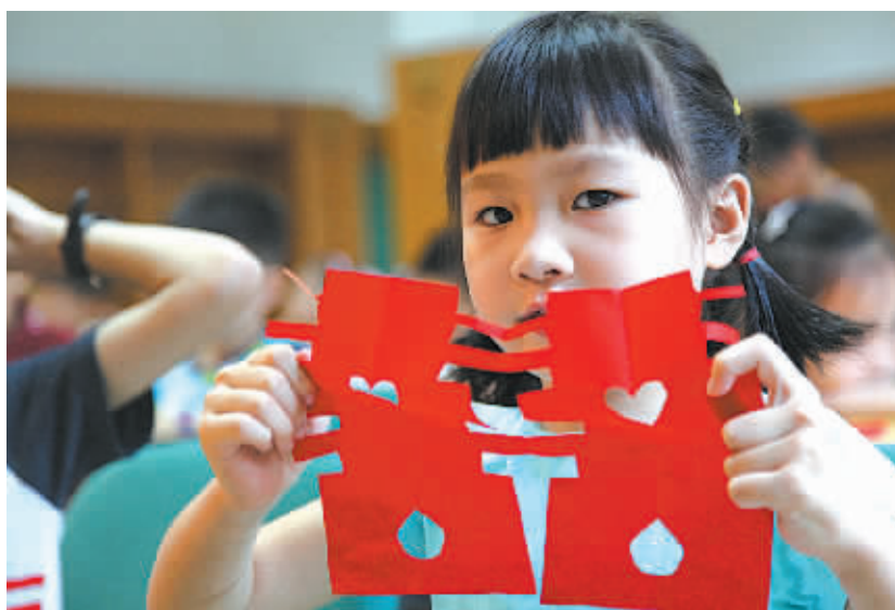
图为在罗老师指导下,孩子们学剪“红双喜”。

本报讯(记者林海 通讯员项晓颖 孙姝姝)记者日前了解到,市图书馆、宁波博物馆先后推出免费夏令营活动,让孩子们度过一个文化暑假。