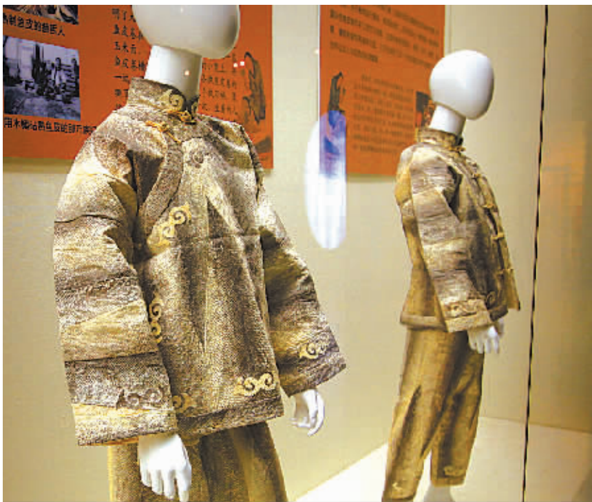
图为宁波市博物馆展出的赫哲族女孩鱼皮衣裤。

本报讯(记者林海 通讯员许婧)对于生活在东海之滨的宁波市民来说,来自黑龙江的国家级非物质文化遗产——鱼皮、兽皮、桦树皮文化(统称“三皮文化”)是个新鲜事物。7月9日起,由宁波博物馆和黑龙江省博物馆联合主办的《从远古走来的渔猎文明——黑龙江鱼皮、兽皮、桦树皮历史文化特展》在宁波博物馆一楼东临展厅正式开展,展期至10月12日止。