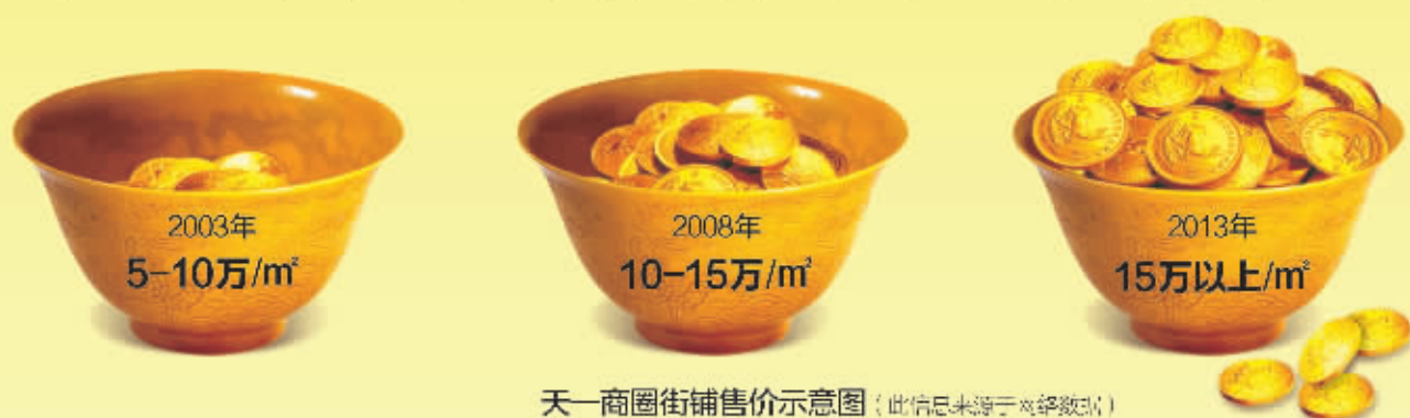
天一商圈街铺售价示意图

买“下一个开明街”，百来万捧走金饭碗 成熟独立街铺，财富传承，资产升级，投资更稳健！