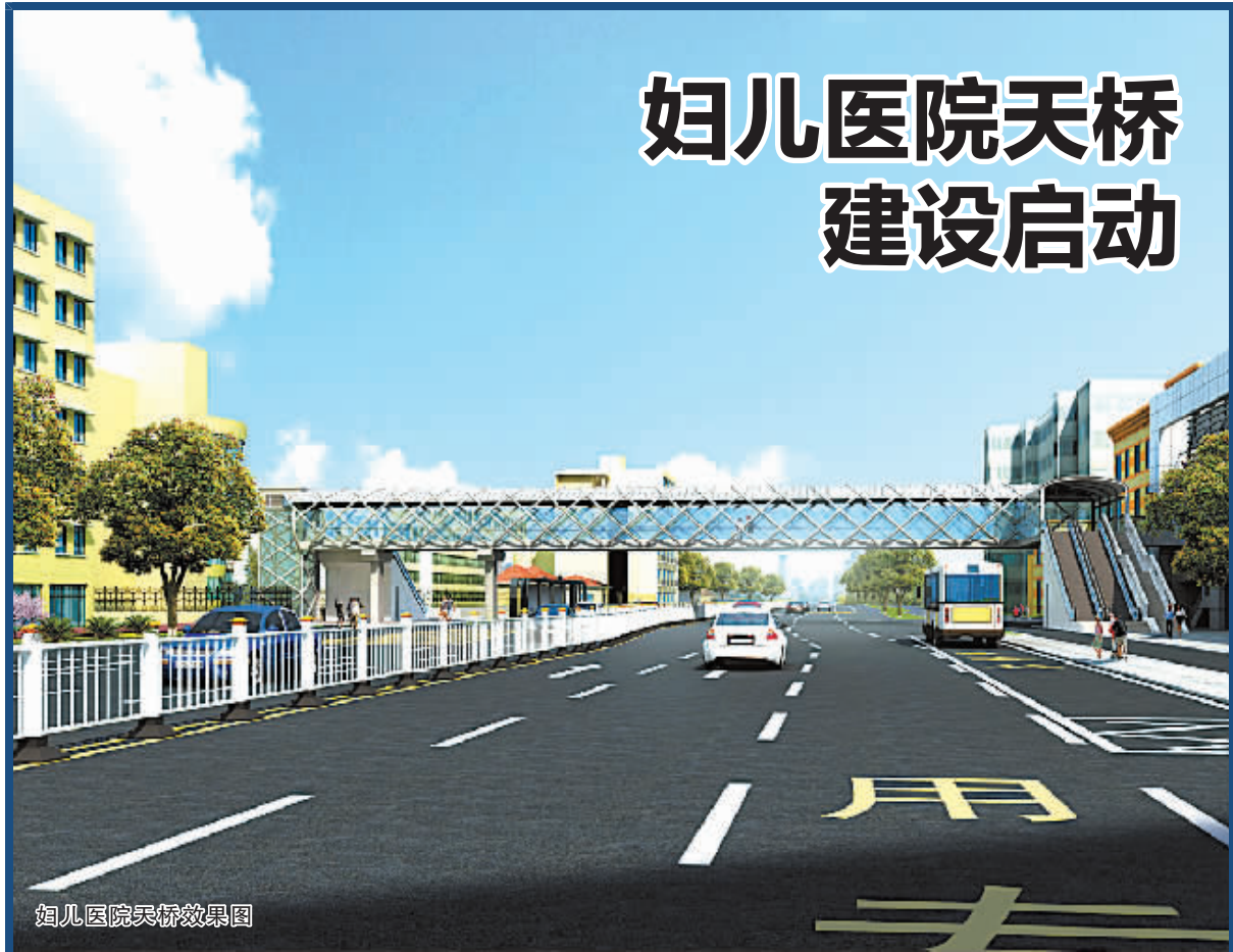
妇儿医院天桥效果图

市人大农委建议,要强化组织领导,进一步发挥规划引领作用,按照“两区”功能建设的要求,合理规划产业布局,加快产业结构调整步伐,做到有目标集聚、按规划实施,有序推进建设。要强化政策支撑,进一步完善“两区”建设管理机制、经营机制和土地流转机制。要强化创新驱动,充分发挥农业科研院所作用,把农业“两区”打造成科技要素的集聚区和技术创新的实验区。要强化服务保障,发挥农业“两区”公共服务中心作用,致力提供全面、专业、便捷的农业公共服务,整合各项涉农服务资源,提供一站式服务。