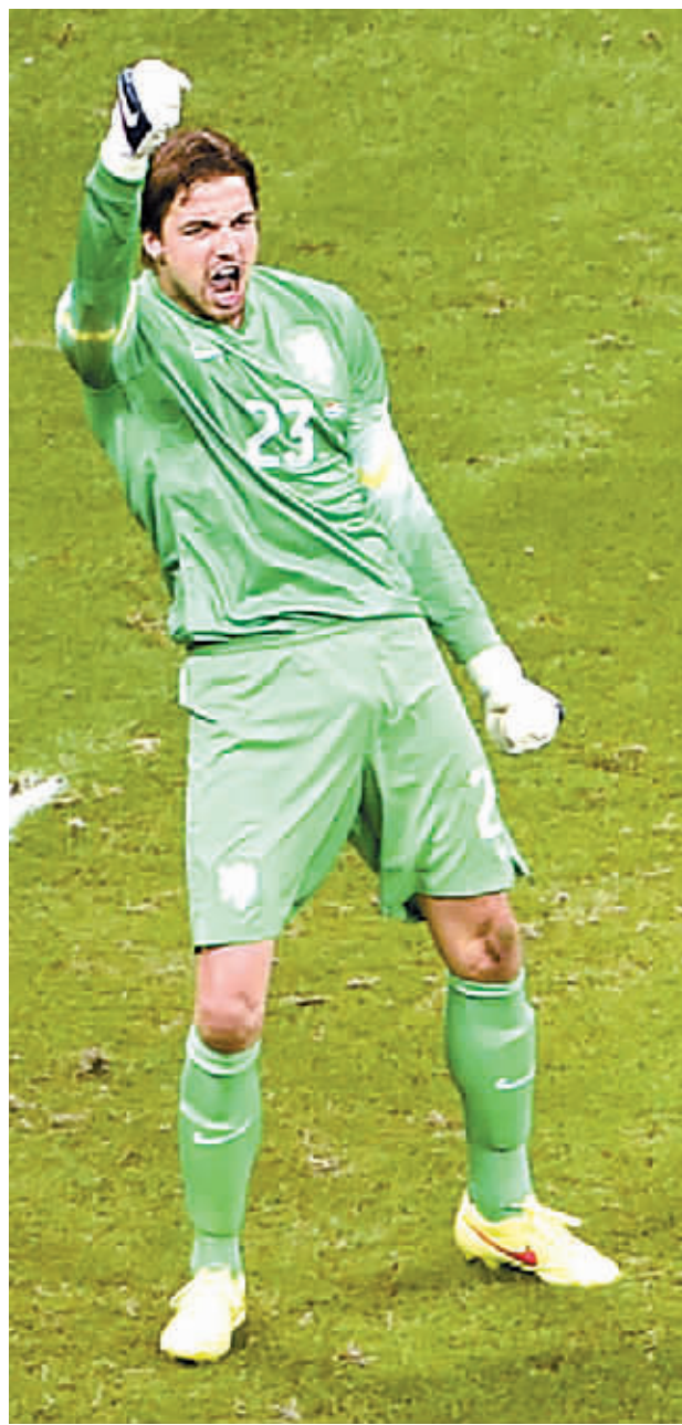
荷兰队守门员克鲁尔扑出哥斯达黎加队球员鲁伊兹的点球后庆祝。