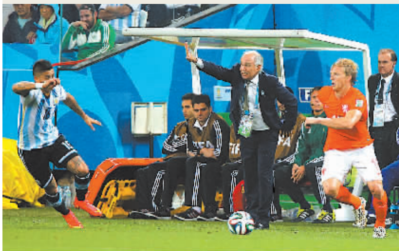
阿根廷队主教练萨维利亚在比赛中指挥。

据新华社圣保罗7月9日电(记者刘宁 吴俊宽)经过120分钟艰苦鏖战，最终通过点球大战4:2淘汰荷兰队，阿根廷人终于时隔24年再次杀入世界杯决赛。阿根廷队主帅萨维利亚9日赛后低调表示，德国队是本届世界杯上最强的队伍，决赛阿根廷队会拼尽全力争取胜利。