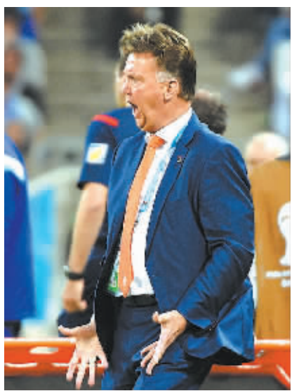
荷兰队主教练范加尔场边指挥。