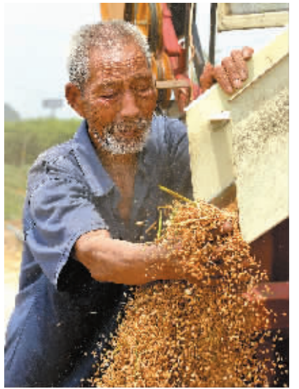
在河南省孟津县平乐镇朱仓村的一块麦田旁，一位老农在收割机前查看刚收打下的麦粒（5月30日摄）。

7月14日，国家统计局发布数据显示，2014年全国夏粮总产量13659.6万吨（2731.9亿斤），比2013年增产474.8万吨（94.9亿斤），增长3.6%，创历史新高。