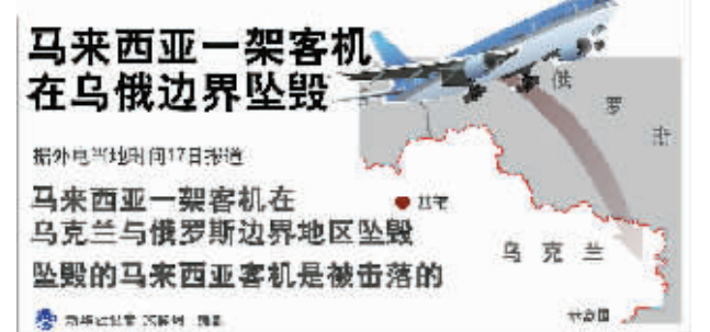
马来西亚一架客机在乌俄边界坠毁

马来西亚航空公司已证实与MH17航班失去联系，并称最后与该客机取得联系的地点在乌克兰上空。马来西亚国防部长希沙姆丁已要求有关方面核实相关情况。