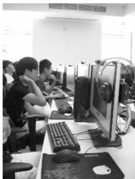
奉化电子竞技爱好者赛前在训练基地进行训练。

昨天上午，位于奉化市区的飞尔网咖内热闹非凡，上百名电子竞技爱好者聚集在这里，共同见证奉化首届电子竞技大赛开幕。身着游戏比赛中人物服装的两名女孩分别扮演“暗夜猫女”和“皮城女警”的角色，为本次比赛增添了更多时尚靓丽的气息。