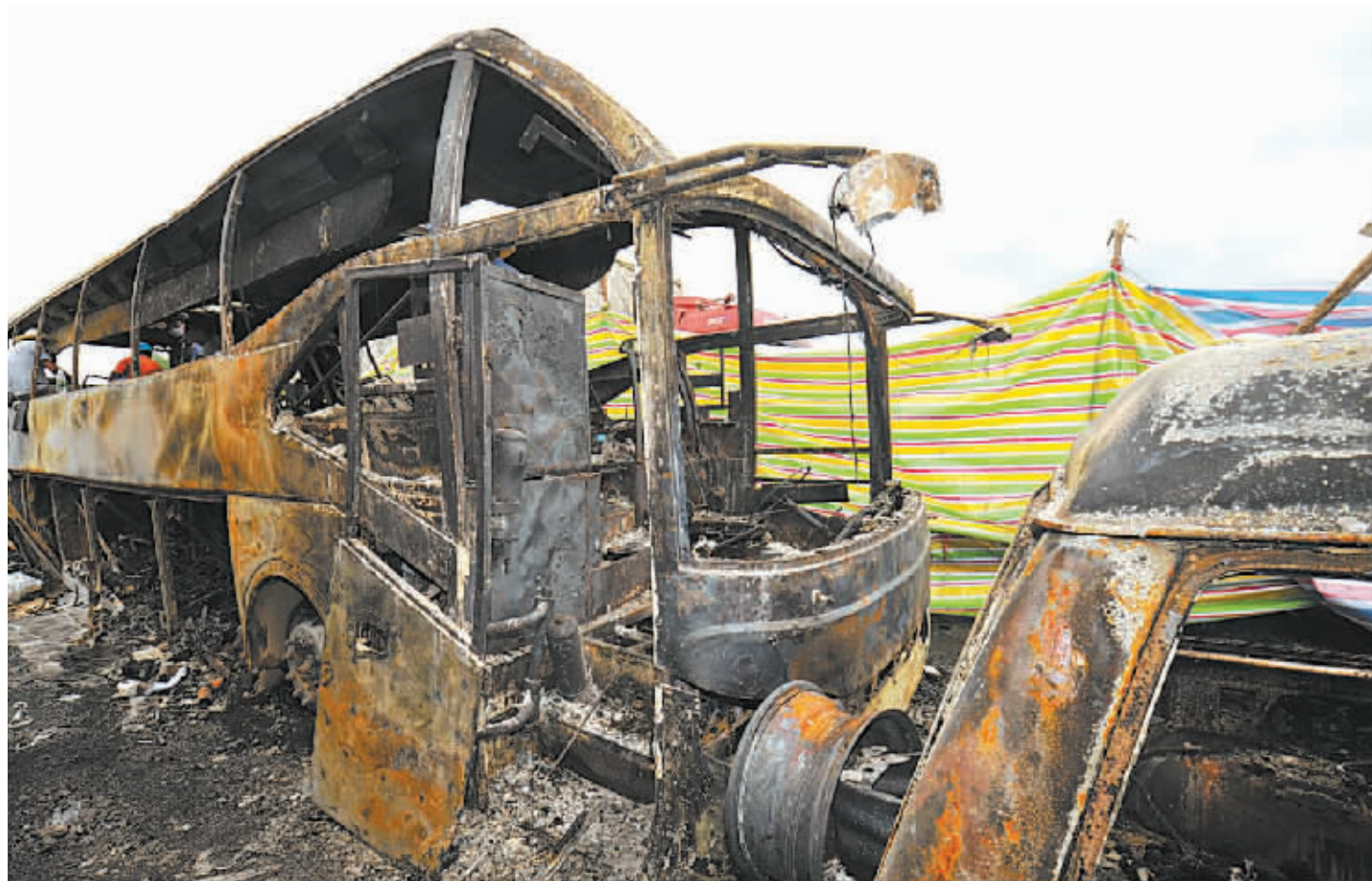
事故中被完全烧毁的大巴车。