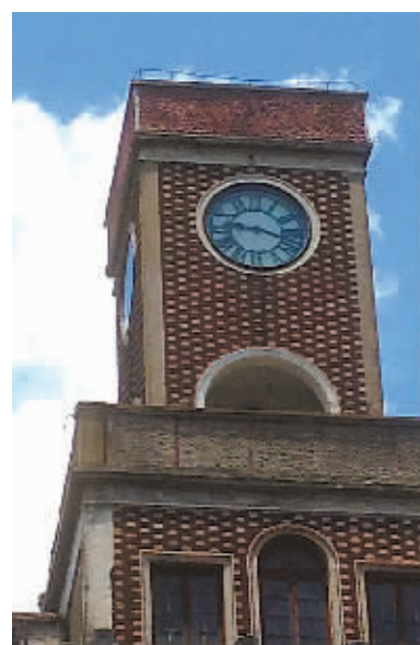
鼓楼大钟南侧钟面停止在9时20分。

“我把大钟的状况向厂方描述后，他们断定是马达的电容出了问题。因为大钟是露天的，打雷时钟的顶部容易引电而造成电容损伤，所以前阵子的雷雨天气应该是造成大钟停摆的主要原因。”蔡主任分析道，“厂方表示路途遥远不方便过来维修，他们答应将配件寄过来，由我们这边的维修人员尝试维修。倘若我们修不好，到时候还是要请钟厂的师傅过来维修。”随后，记者联系了上海诚安塔钟制造有限公司的顾经理，顾经理告诉记者，前天他们已将大钟的配件寄出，预计今天就能抵达宁波。顾经理说：“这座大钟是2009年安装的，属于机械电子一体化的钟表，采用了微电脑技术。马达上的电容容易老化，需要每年更换一次，所以这还要靠管理部门多加重视，加强日常养护。”据记者了解，鼓楼大钟在去年9月份已经停过一次，也是联系了上海钟厂前来维修才恢复正常。关于鼓楼大钟的养护问题，蔡主任说：“大钟的保修期已经结束，接下来我们筹划与厂方签订延长保修期