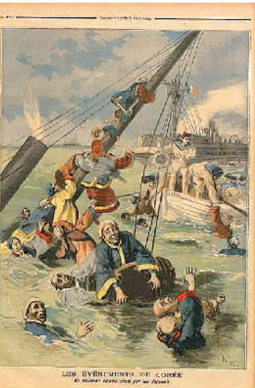
法国 Le Petit 杂志刊图描绘法国炮舰 Le Lion 号救援沉没的“高升”号中国人员的情景。(资料图片)

1894年，朝鲜发生东学党起义，朝鲜政府很长时间无法平息。不得已，朝鲜政府请求中国政府给予援助，日本获悉这一消息后，积极鼓励清政府向朝鲜派兵，同时日军也向朝鲜派兵，而且规模巨大，持续不断。 东学党起义平息后，中国动议中日两国同时撤兵，日本军队虽然没有了在朝鲜继续留驻的理由，但日本在朝鲜与清军一战的决心已定，根本不可能同意撤兵。日本的挑衅激起清政府内部不满。中国国内舆论和清军驻朝将领纷纷请求清廷增兵备战，朝廷里也形成了以光绪帝、户部尚书翁同龢（光绪帝老师）为首的主战派。7月14日，李鸿章根据清廷指示，抽调精兵开赴朝鲜。 7月21日下午，满载清军和武器弹药的“爱仁”号从天津大沽开行。第二天傍晚，“飞琼”号离港。第三天晚上，“高升”号从大沽启程。北洋海军副将方伯谦率“济远”、“广乙”、“威远”三舰护航。7月25日，日本不宣而战，在朝鲜丰岛海面袭击了“济远”、“广乙”，丰岛海战爆发，海战中日本联合舰队第一游击队的“浪速”舰悍然击沉了清军借来运兵的英国商轮“高升”号，一千多名清军官兵丧命大海，制造了“高升”号事件。至此，日本终于引爆了甲午中日战争。 8月1日，中日两国同时发布宣战诏书。