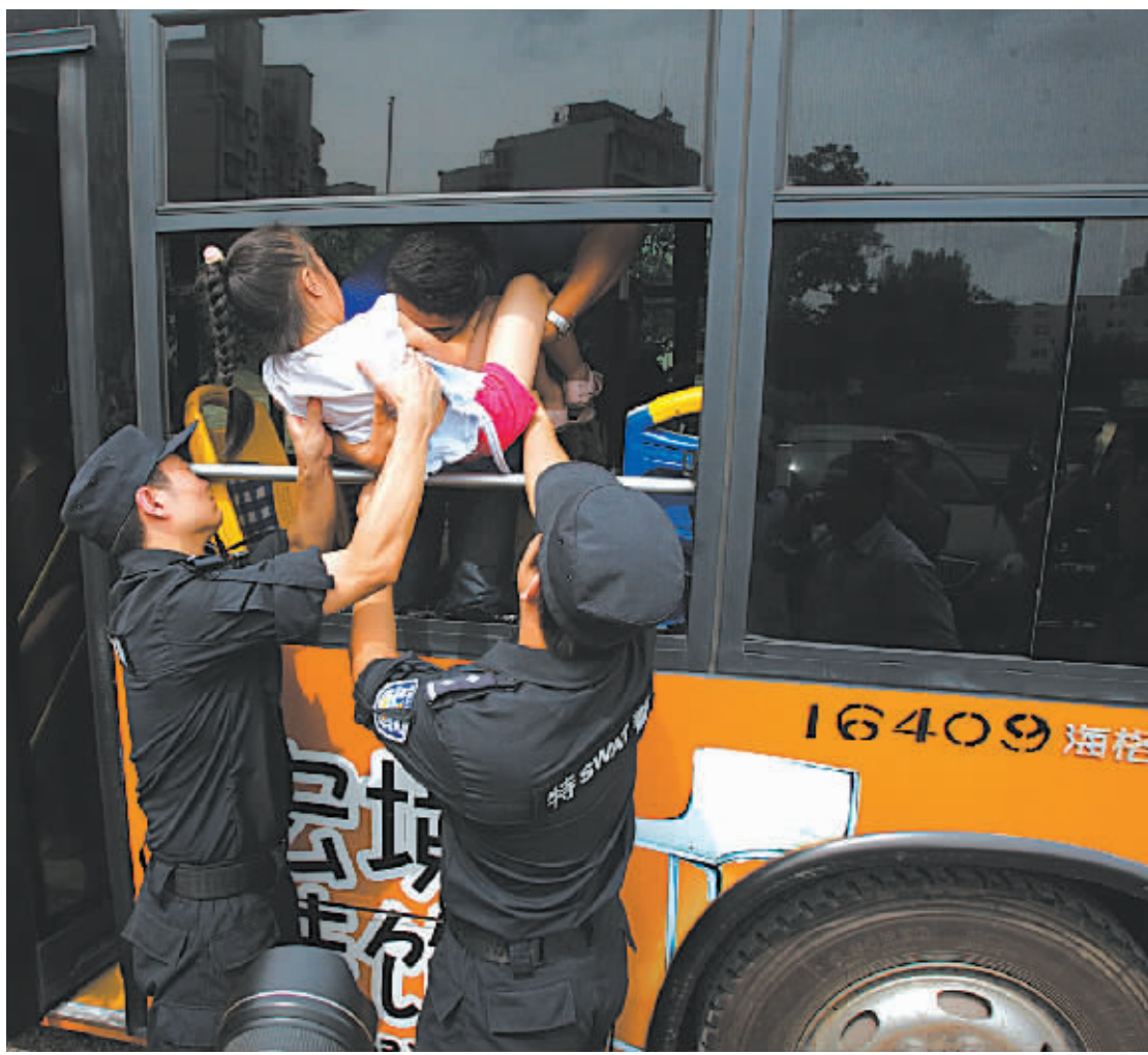
昨天上午，海曙交警联合公交公司、消防等多个部门，在周江岸社区举行公交车逃生演练。烟雾重重，“惊心动魄”时刻，破窗、逃生、救援、灭火，一气呵成。居民们说，这样的实战演练，只要亲身经历过一次，以后就知道该怎么做了。图为演练现场。