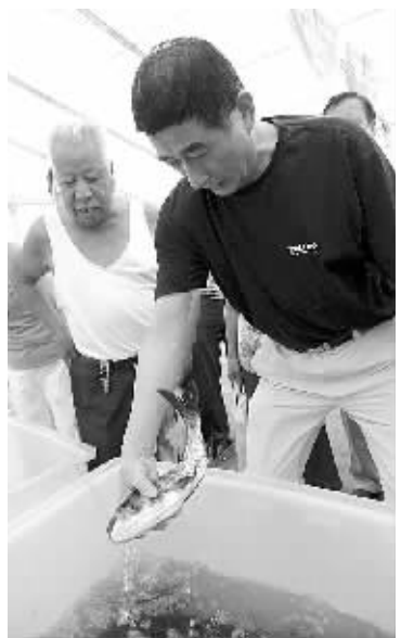
鲜活的白鲢鱼受到市民青睐。

本报讯（记者张正伟 通讯员王鹏云）水果搬上淘宝、微信扫码享优惠、进口海鲜跨境购……昨天开幕的宁波市菜篮子商品淡季展销会，许多时尚元素亮相，让这一传统展会一下“老少皆宜”起来。