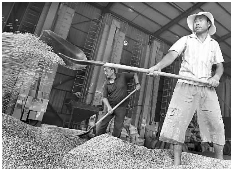
烘谷中心 让粮农省心

察”、“宁波城市”、“民生经济”、“社会百态”等特色栏目。中国网络电视台宁波分台是CNTV开放平台上少数几家城市分台之一，也是宁波广电集团依托中央级网络媒体，探索媒体融合发展之路的战略举措。中国网络电视台宁波分台的建成上线，对讲好宁波故事，传播好声音，提升宁波城市在海内外的影响力，具有十分重要的推动作用。