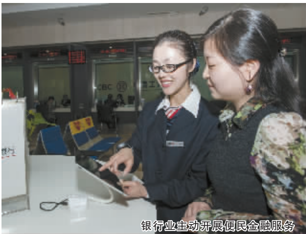
银行业主动开展便民金融服务