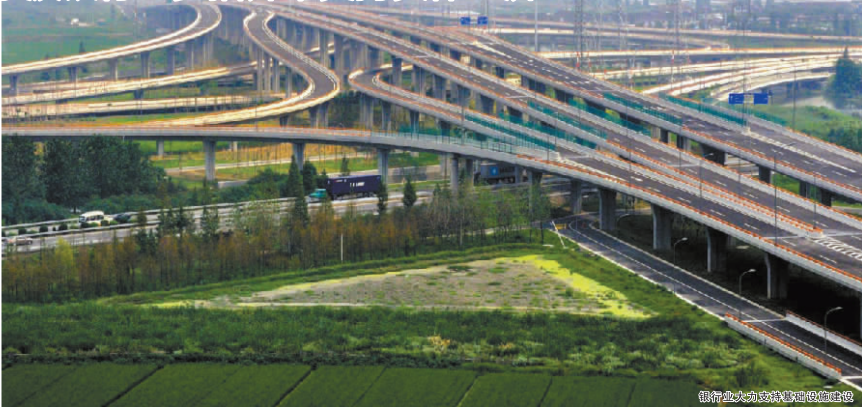
银行业大力支持基础设施建设

当前，宁波银行业总量规模保持稳定增长，信贷结构逐步优化。在深化产业结构调整上，各银行机构着力“盘活存量、用好增量”，通过收回再贷、兼并重组、资产证券化等方式盘活存量信贷资产286.07亿元。在保障重点项目建设上，全力支持“五水共治”、民生福祉改善、发展基础强化等重点项目，截至6月末，共计为全市447个重点项目发放贷款794.3亿元，比年初增长24.39%。在深化小微企业金融服务上，宁波银监局继续实施差异化监管措施，有效扩大综合金融服务覆盖面，截至6月末，宁波银行业用于小微企业的贷款余额4931.98亿元，较年初增加142.17亿元。在大力发展普惠金融上，银行业金融机构健全“三农”服务网络，提升服务水平、加大金融支持“三农”发展力度，截至6月末，全辖涉农贷款余额5061.25亿元，占全部贷款的35.77%，比年初增加267.37亿元。