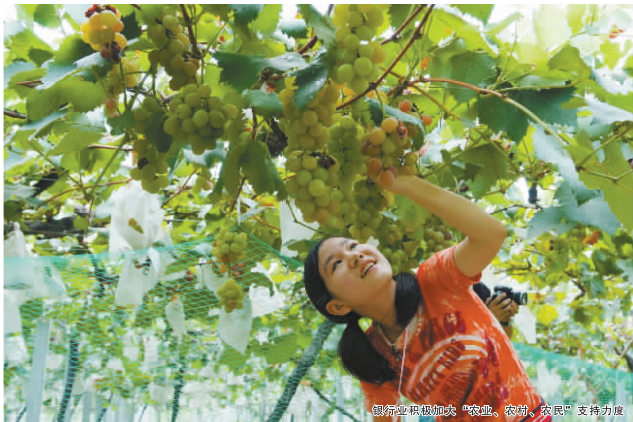
银行业积极加大“农业、农村、农民”支持力度

各银行还着力渠道突破，拓宽重点项目资金来源，截至6月末，宁波银行业通过非传统信贷融资渠道为重点项目融资176.57亿元，规模已超过贷款增量。如兴业银行宁波分行通过证券公司债权管理计划成功为宁波南站区域棚户区改造项目募资40亿元；建设银行宁波市分行通过对接“乾元”系列委托贷款型人民币理财产品成功为保障房项目融资7亿元；工商银行宁波市分行试水林权抵押贷款，为宁波市小浃江河道治理工程提供4亿元贷款；农业银行宁波市分行首次将污水处理收费权质押贷款引入重点项目建设，为大榭开发区治污项目融资3000万元。