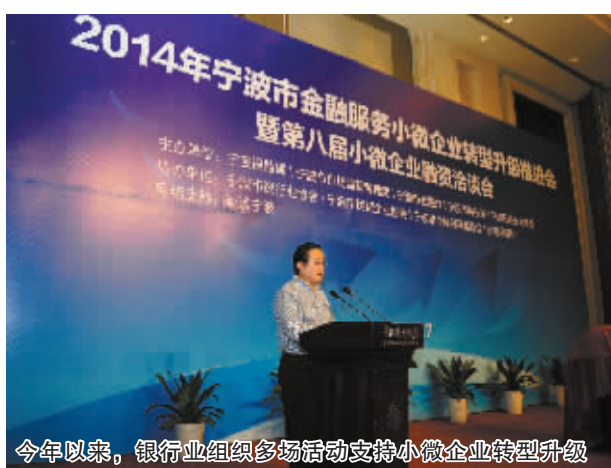
今年以来，银行业组织多场活动支持小微企业转型升级

“今年以来，宁波银行业通过‘收回再贷、兼并重组、资产证券化、直接融资置换贷款、批量处置不良资产、呆账核销’等方式，大大加快了信贷存量的盘活速度。”宁波银监局相关人士对记者介绍说。