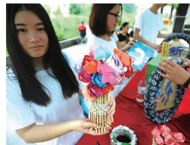
近日，浙江万里学院的志愿者来到江东太古城社区开展环保宣传活动。他们利用废旧材料现场制作插花、挂件等装饰品，展示后赠送给社区居民。