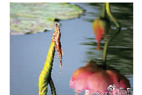
(记者 金雅男 王珏 整理)

# 宁波微影 # @常乐老兵：“奇了，河蚌抱在荷尖上，这案子没听说过。”一位70多岁的老汉如是说。离岸5米左右的一个荷尖，离水面十几厘米，上面一只蚌“死死”地抱着荷尖，蚌身略见一点红色。路人看到我相机里清晰的画面啧啧称奇。借渔竿拔下来看，估计是在放于时来不及脱身。