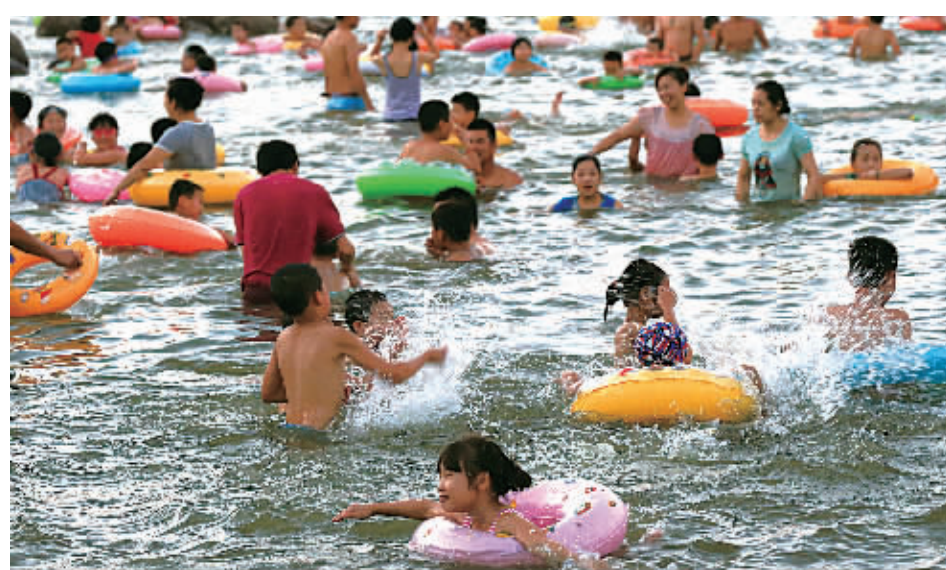
日湖公园黄金沙滩露天游泳场人潮汹涌。

本报讯(记者厉晓杭 实习生徐欢欢 通讯员邱颖杰)台风“娜基莉”的脚步刚刚远去，盛夏的热情已不可阻挡。昨天，高温再度席卷甬城，最高温度达到36.4℃，“烧烤”模式再度启动。 根据气象部门监测显示，昨天甬城的气温属于“高开高走”。昨天早上8时，气温已飙升至29.9℃，正午12时则一跃至34.5℃，逼近高温线。昨天上午11时，市气象台发布高温报告，受副热带高压影响，今天我市大部分地区最高气温将达36℃，请各有关方面做好防暑降温工作。 有关气象专家表示，尽管天气炎热，午后雷阵雨也在蠢蠢欲动，虽然不会大范围来袭，但局部地区难以幸免。 另外，今年第11号超强台风“夏浪”目前仍在菲律宾以东的洋面上，市气象台正在密切监测，未来三天内对我市没有影响。