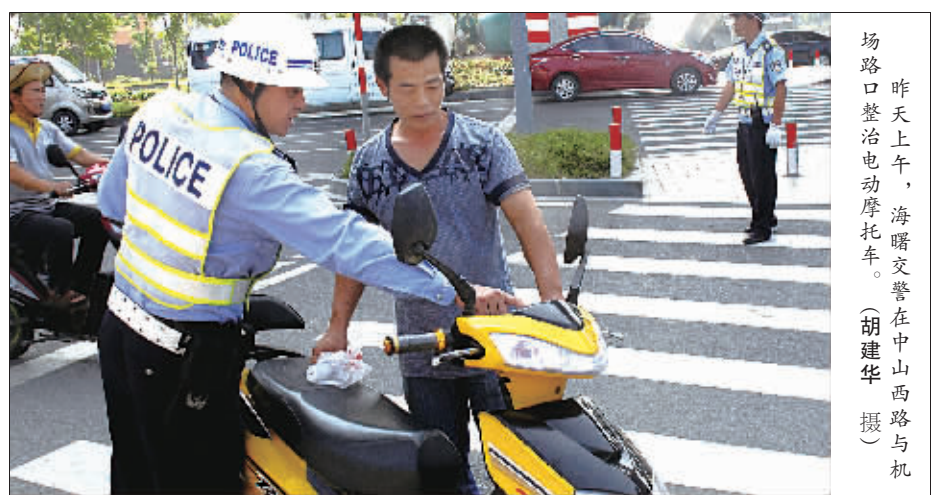
昨天上午，海曙交警在中山西路与机场路口整治电动摩托车。

据了解，从8月1日起，每位执法交警配备了新式执法记录仪，在规范执法的同时也进行自我保护。有了监控，被拦下的车主也文明了很多。