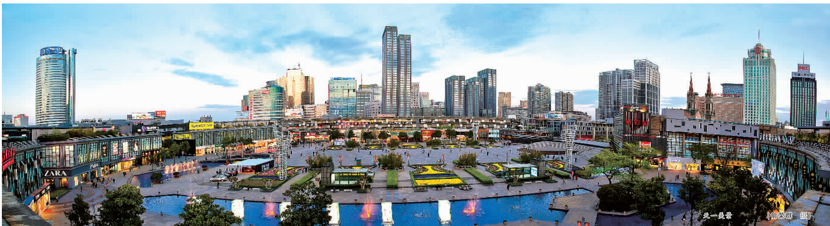
天一镜像