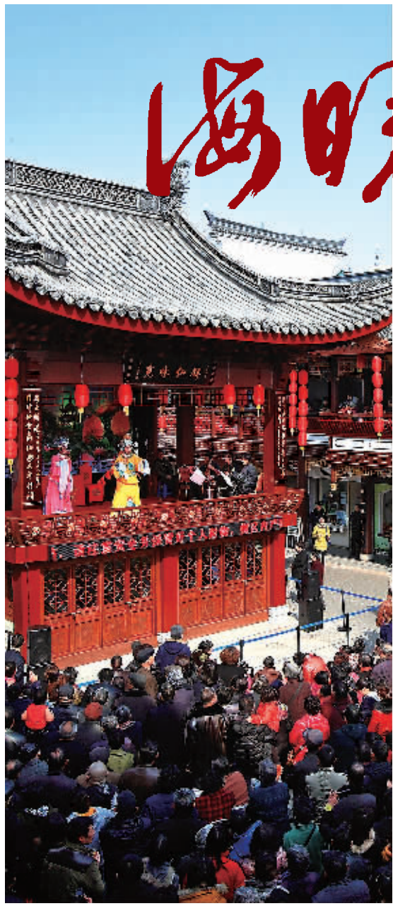
鼓楼梨园