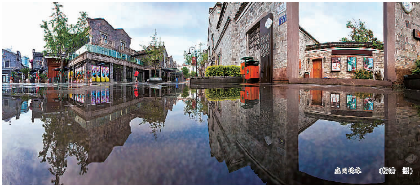
盛园镜像 (杨清 摄)

海曙区还别出心裁地制作了一本手绘地图,标注了藏书楼、水利设施、城楼、宗教建筑、仓库遗址、名人故居、重要桥梁,以及宁波以前对外交往的场馆、近代的建筑遗址等40多个文化遗产点。只要按图索骥,我国首次发现的古代地方城市大型仓库遗址永丰库、全国唯一保存完整的钱庄业历史文化建筑钱业会馆、明州与高丽友好交往的历史见证高丽使馆遗址等便一目了然。