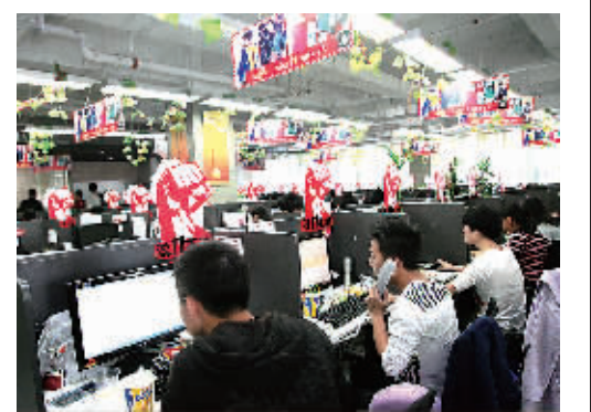
电商奋战“双十一”

宁波(国际)电子商务产业园将实现电子商务企业办公、仓储和物流的集中运作。“目前,中国(宁波)跨境贸易电子商务产业园区已经竣工,海关、国检、邮政等部门已入驻办公,通过批复后就能够提供一站式国际邮包通关出口服务。”该产业园管理中心主任吴汉元介绍,产业园开园后,将为宁波2万多家传统外贸企业带来新的发展契机,更将在宁波外贸史上添上浓墨重彩的一笔。