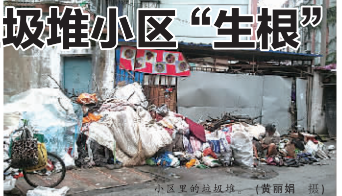
小区里的垃圾堆。

“目前,经过协商,大妈的儿子表态说,下个月会把母亲接走。等其走后,社区会再集中清理一次。”汪书记说。