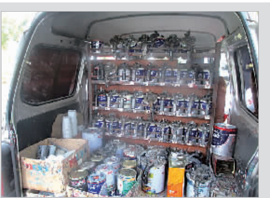
图为查获的改装调漆车内部。

运管执法人员告诉记者,这种改装的“调漆车”,严重扰乱道路运输市场秩序,安全隐患很大。下阶段,鄞州运管部门将对辖区范围内车辆运输严加管理,并加强对汽修店高温季节经营活动的安全检查。汽修店业主如果发现类似上门调漆行为,可通过96520投诉举报电话向运管部门反映。