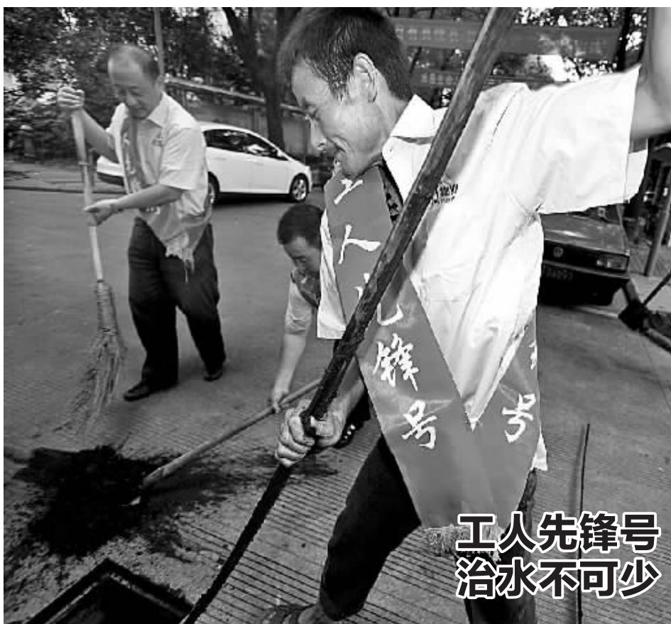
昨天,江东新物业管道疏通班员工在丹凤社区疏通下水道并清理窞井口垃圾。当天,由市总工会组织助力“五水共治”集中行动在全市100家工人先锋号班组展开,约有3000名职工积极响应。

本报讯(记者黄程 通讯员张楠)中国首个“全球创新改善奖”花落杭州湾新区民企方太集团。在近日举办的2014年全球创新大会上,方太与华为、美的、海尔等知名企业一起,首次参加评选。在与来自韩国、日本、德国、英国等国家众多知名企业的革新案例与创新改善“PK”中,方太成为首个也是唯一获“全球创新改善奖”的中国企业。