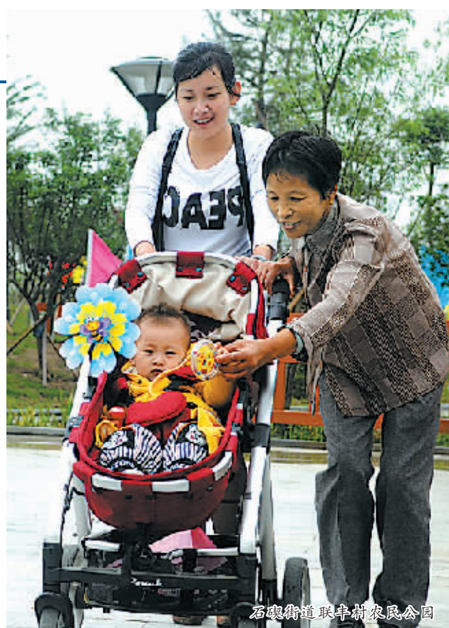
石梁街道 联丰村农民公园

在城乡融合发展长期居于全省前列的基础上，不久前，鄞州又出台《关于全面深化农村改革打造城乡融合发展示范区的若干意见》，在“镇村建设美家园、转型升级促发展、强村富民增福祉、改革创新添活力”的工作总要求下，力争到2016年，初步建立城乡融合发展体制机制及制度体系，城镇化率超过71%，城乡居民人均纯收入之比缩小到1.95:1以内，统筹城乡发展水平综合评价得分达到95分；到2020年将率先建成“经济发展同步、面貌环境同变、基础设施同城、公共服务同质、民生保障同等、社会治理同规”的城乡融合发展示范区。