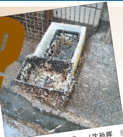
塑料筐内外,鸡毛散落。

主城区全面禁止活禽交易,家禽不是“杀白上市”吗?为何这里仍在宰杀活鹅?不过,他说这两天店家已有所收敛,没有看到当街脱毛、摆活活鹅当“招牌”的场景。