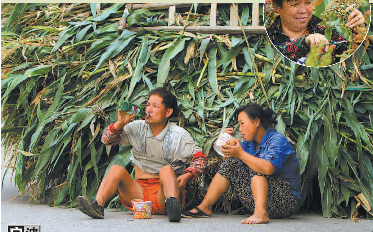
又是一年高粱红。日前,余姚临山的高粱地里一片丰收景象。中午时分,这对农户夫妇总算歇了下来。他们坐在路边,靠着高高的高粱堆,忙里偷闲,吃着泡面、喝点小酒,享受丰收的喜悦。