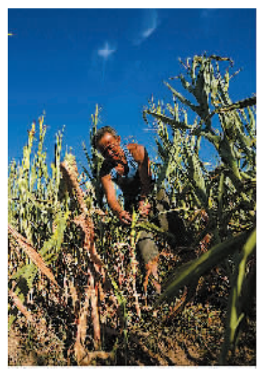
8月12日,阜新蒙古族自治县蜘蛛山乡蜘蛛山村的一位村民在查看自家玉米地的受灾情况。

新华社沈阳8月13日电(记者徐扬)记者13日从辽宁省气象局获悉,截至12日,辽宁7月以来