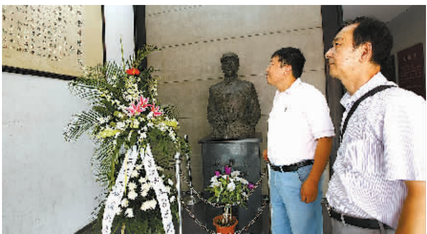
8月13日,在上海苏州河北岸的四行仓库大楼,两位市民向民族英雄谢晋元的铜像献上鲜花后,观看墙上关于四行仓库保卫战的介绍。 当日是“八·一三”淞沪会战77周年纪念日,一些市民来到淞沪会战的战场遗址——上海四行仓库大楼凭吊英烈。