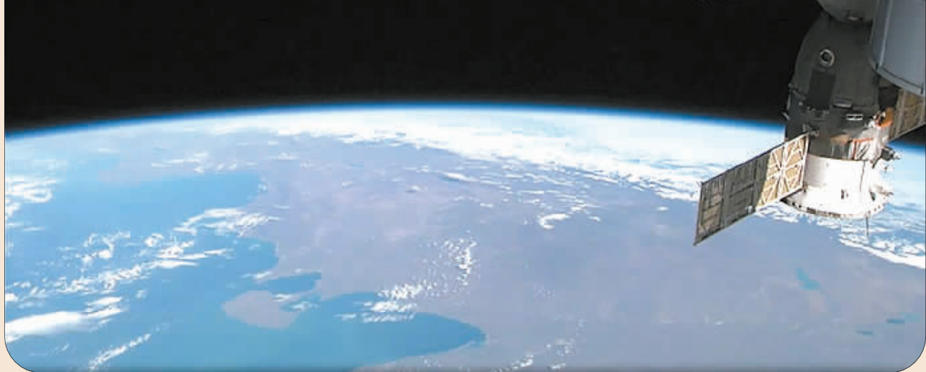
这张美国国家航空航天局8月12日公布的照片显示的是国际空间站在围绕地球的轨道上运行。

这是欧航局向国际空间站发射的第五艘也是最后一艘自动货运飞船。该货运飞船于今年7月30日搭乘一枚阿丽亚娜5型火箭从法属圭亚那库鲁航天中心发射升空。这艘飞船全长10.27米,最大直径4.48米,重约20.06吨,是迄今阿丽亚娜5型火箭搭载的质量最大的航天器。