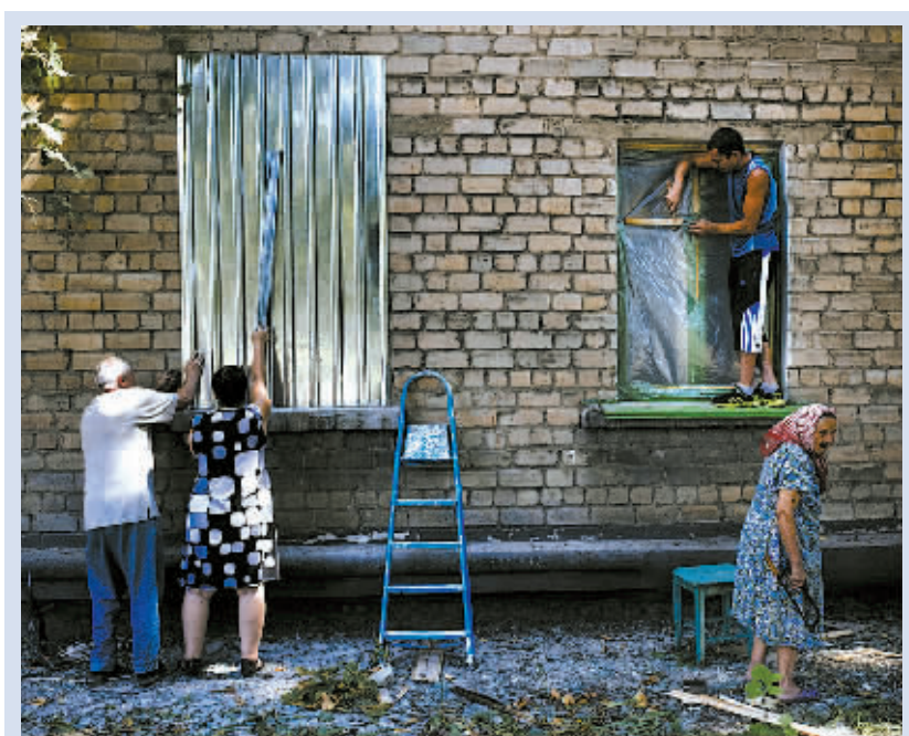
在乌克兰顿涅茨克,当地居民在破损的窗户外封上塑料膜和钢板。

电话,对俄向乌克兰派遣人道主义车队表示“非常担心”。奥朗德认为其他国家只有在乌克兰政府同意的情况下,才能在乌境内实施人道主义行动。