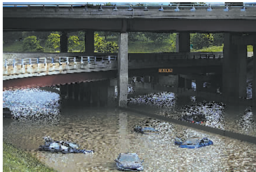
8月12日,在美国密歇根州的罗亚尔奥克,汽车浸泡在高架桥下的洪水中。近日,暴雨在美国密歇根州局部地区引发洪灾。