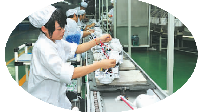
今年上半年,沁园集团研发50多个新产品投放市场,产值增长超过70%。

做好重点企业的服务保障工作,确保企业尽快释放产能,帮助解决融资、土地等问题,尽快帮助企业达产生产;深化创新平台建设,坚持创新面向市场的策略,以企业为创新主体,积极引导企业加大科研经费投入、建立研发机构,加强科技成果转化力度。(项一嵌整理)