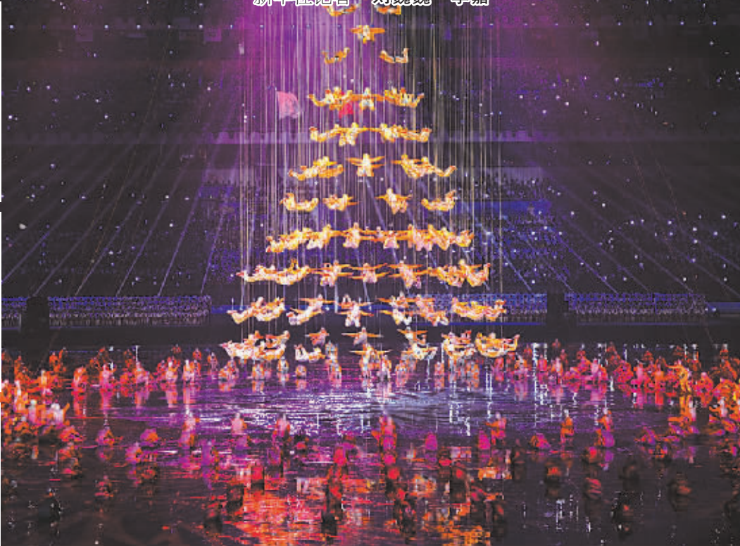
开幕式文艺演出。