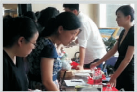
8月11日—8月12日 第三站: 中国电信宁波分公司