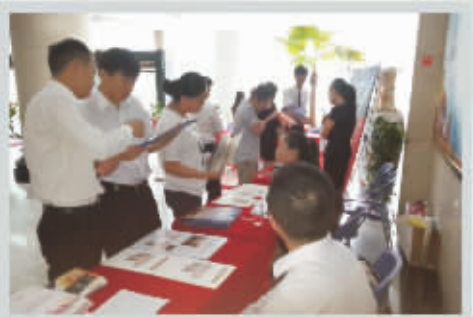
8月13日—8月14日 第四站: 宁波石油分公司