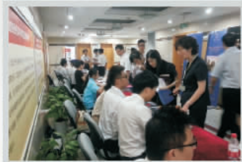
8月3日—8月4日 第一站: 中国银行宁波市分行