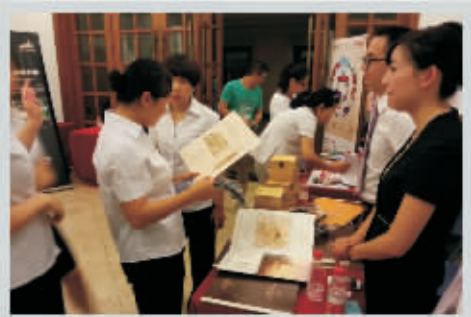
8月5日—8月6日 第二站: 中国人保宁波分公司