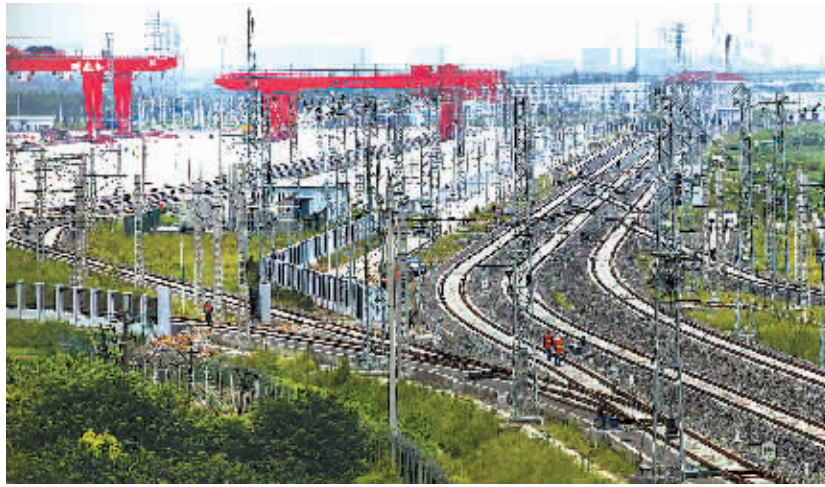
新铁路宁波货运北站。