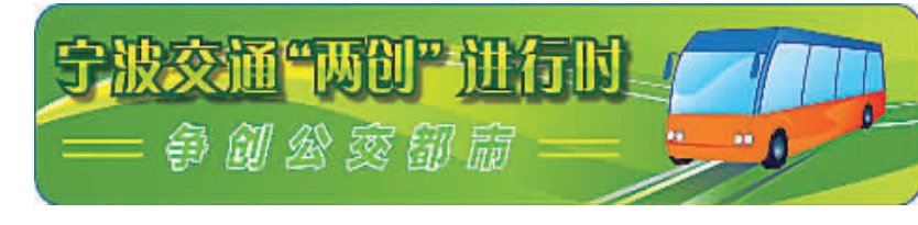
宁波交通“两创”进行时 争创公交都市

“感谢这么多热心单位对宁波公共自行车事业的支持和帮助，我们也将进一步在管理上推陈出新，在服务上开拓创新，为甬城市民带来更优质的服务。”自行车营运公司负责人通过本报表达由衷的感谢。