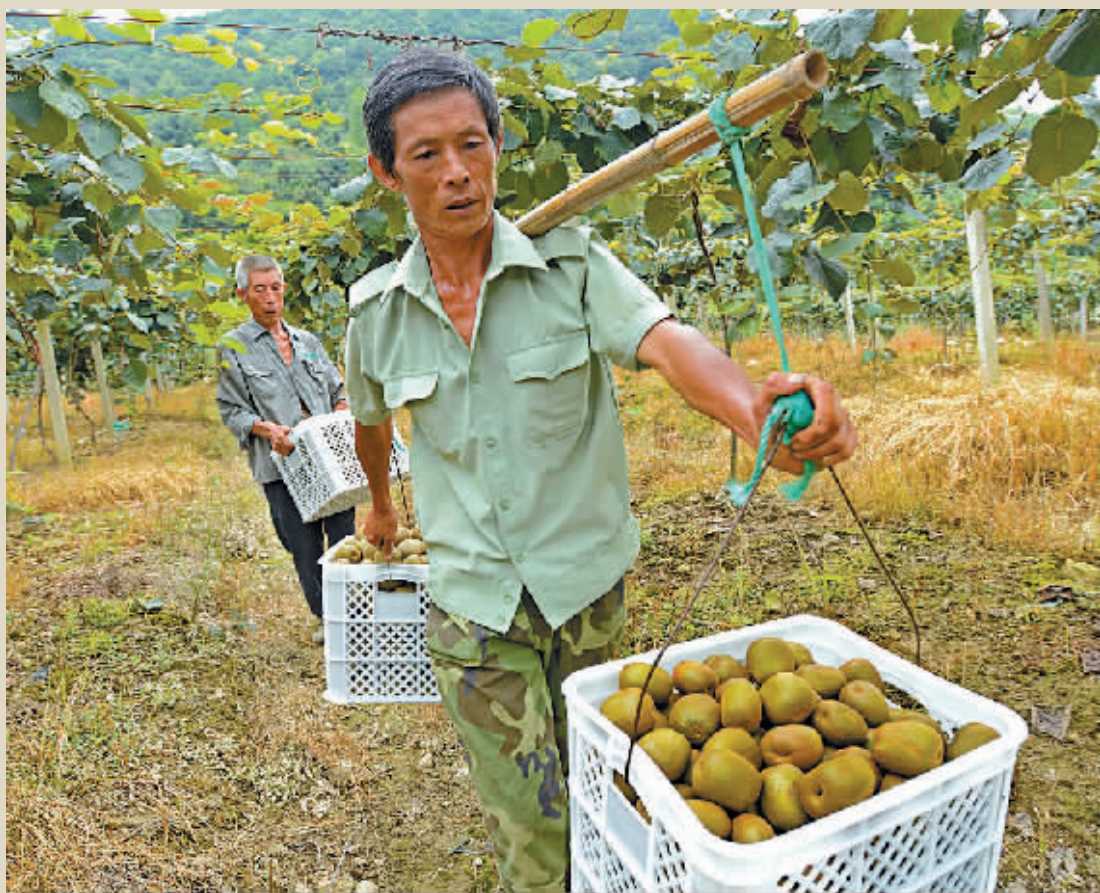
昨天下午，象山县泗洲头镇祥峰红心猕猴桃种植基地，果农们正忙着采摘。据介绍，该基地猕猴桃种植面积120亩，经过三年精心培育，今年正式挂果，第一年亩产2000公斤左右。目前，这种猕猴桃市场售价约50元/公斤。