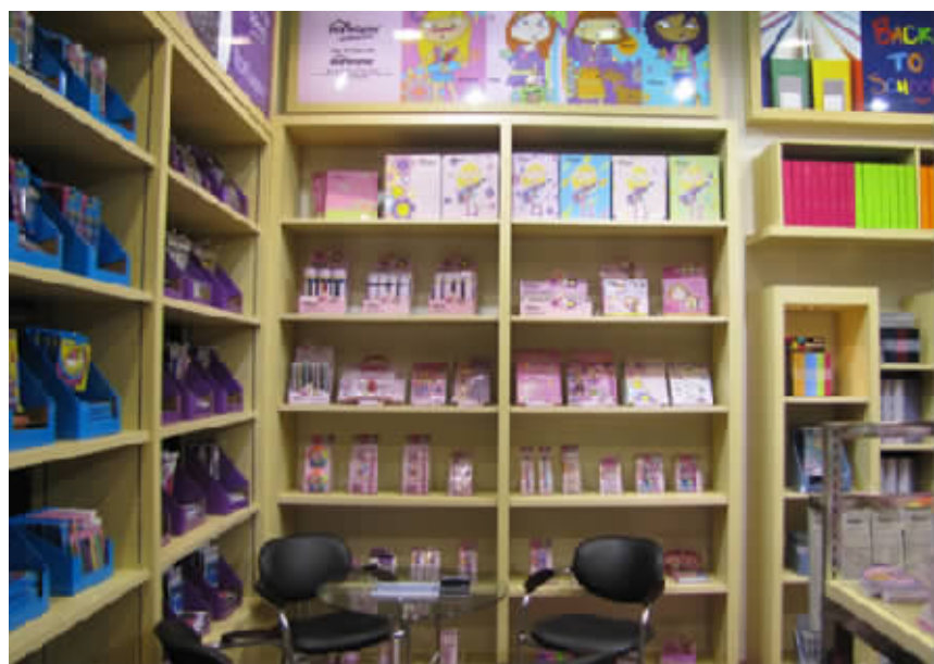
图为宁波美博进出口有限公司样品展示间。

新员工培训时了解到的，如果说这只是一段工整的“说明文”，那么在我的工作中所接触到的人与事，就是“美博”日益发展壮大生动诠释了。