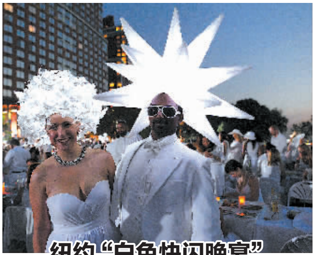
纽约“白色快闪晚宴”

8月25日,在美国纽约洛克菲勒公园,身着白衣的人们参加“白色快闪晚宴”。当晚,数千名身着白色服装的男女出现在纽约洛克菲勒公园,自备食物、酒水及餐具,在白色餐桌上优雅用餐。“白色快闪晚宴”的参加者直到晚宴开始最后一刻才会知道用餐地点。此活动源于法国,已有25年历史。