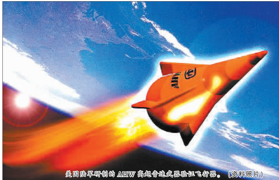
美国陆军研制的AHW高超音速武器验证飞行器。(资料照片)

“先进高超音速武器”由桑迪亚国家实验室和美国陆军联合主导研发,其滑翔体依托于一个名为“战略目标系统”(STARS)的三级固体燃料火箭助推器,滑翔体与助推器分离后,能够以高超音速飞行。