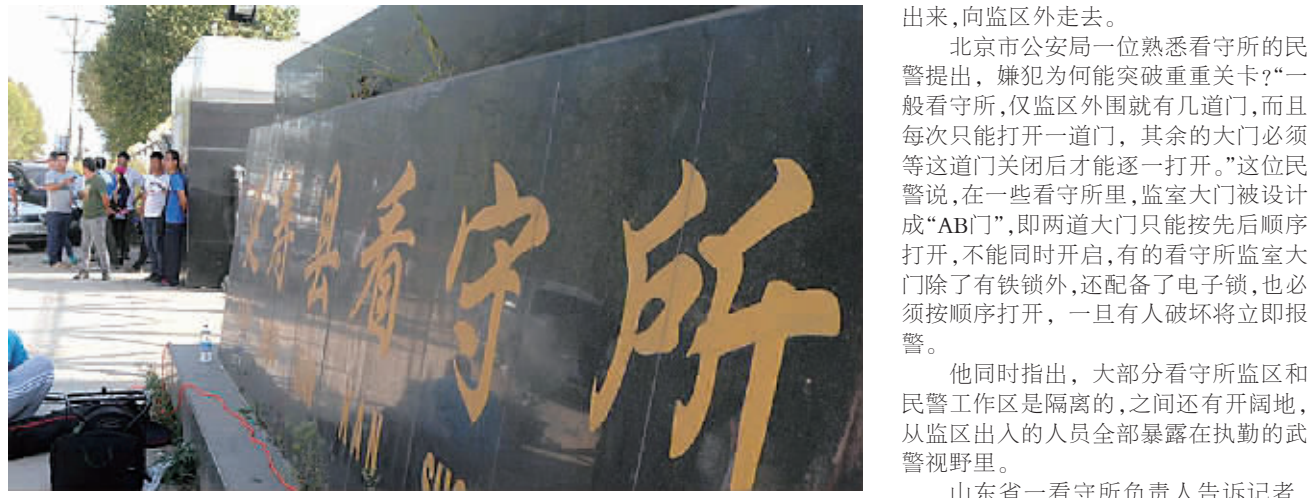
这是9月2日拍摄的黑龙江延寿县看守所门口。