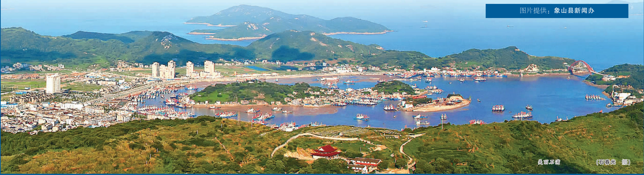
美丽石浦