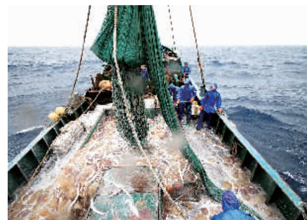
远洋捕捞

与此同时，卫星城建设也让石浦的社会治理得到进一步加强。如：该镇高度重视信访和调解工作，完善矛盾纠纷排查化解机制，严防群体性事件发生；发挥社区、社会组织作用，创新社会管理，推进“网格化管理、组团式服务”；加强社会治安综合治理，健全社会治安防控体系，依法打击各类违法犯罪行为，不断提高群众安全感和满意度。深化公共文明和人文素质提升工程，不断提高城市文明程度和市民文明素质。