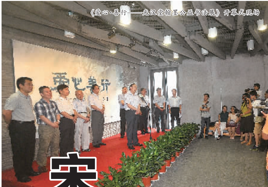
《爱心·善行——光汉堂翰墨公益书法展》开幕式现场