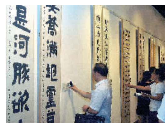
书法展上，观众通过扫描二维码，又买书法作品投入公益事业

一句，那就是“书法有爱”——书法与公益结合，让人们在关心公益的同时，主动地了解书法，欣赏书法。他说，慈善助人是人间大道，通过书法播慈善，能够把幸福传递给更多的人。“推动书法艺术社会化的这条道路我会继续走下去，公益书法展只是一个起点。”