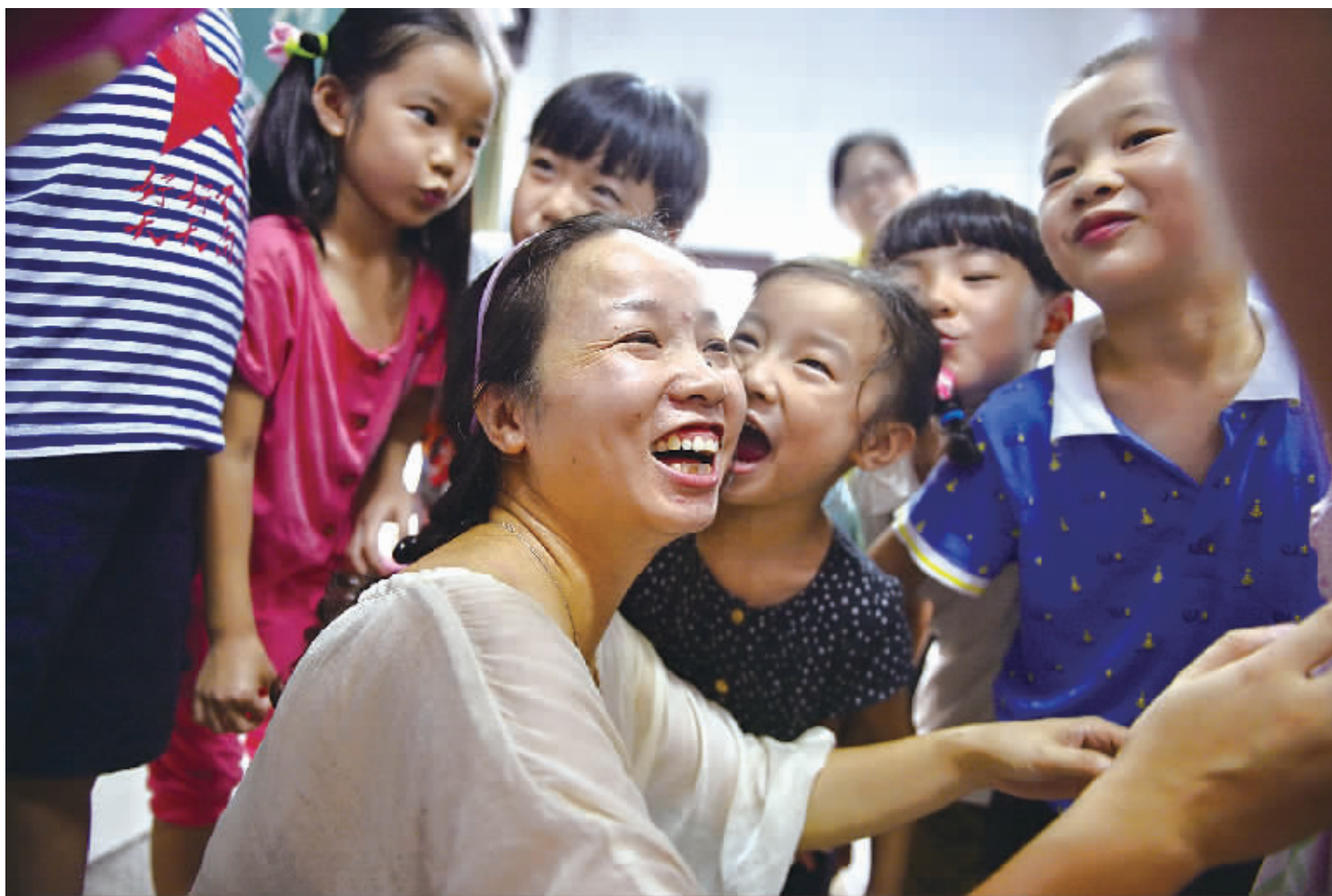
9月10日,一年级学生轮流拥抱和亲吻老师。

山西大学附属中学一位老师也说,教师节送礼表达的不是对老师的敬意,有种被收买的感觉。为了送礼而送礼,这是一种本末倒置。让送礼变成了某种形式的“交易”,则是对“尊师重道”传统的玷污。