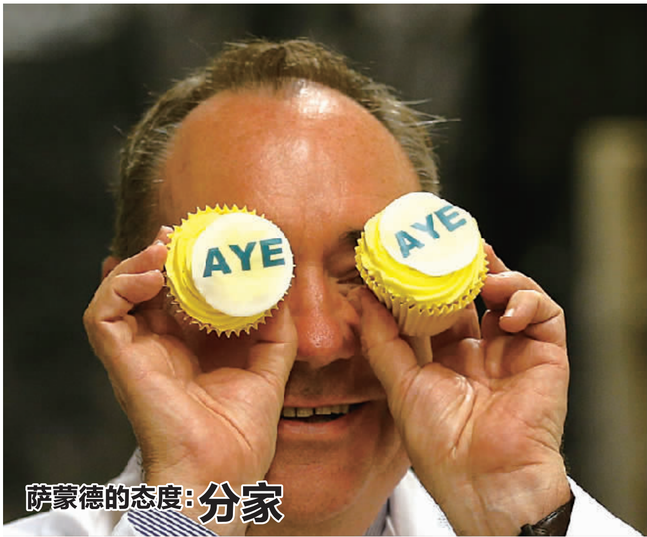
萨蒙德的态度：分家

早在1977年，即女王加冕25周年当年，苏格兰和威尔士地区正以需要更大自主权为由而举行投票。伊丽莎白二世利用加冕周年纪念期间的一次演讲对国家分裂发出明确警告，被认为帮助化解了那次危机。