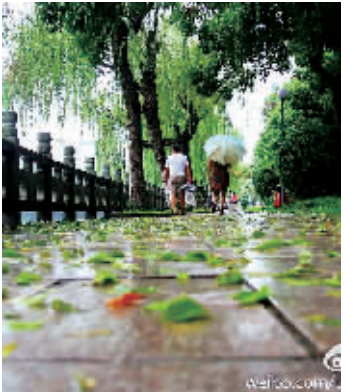
(记者 金雅男 王珏 整理)