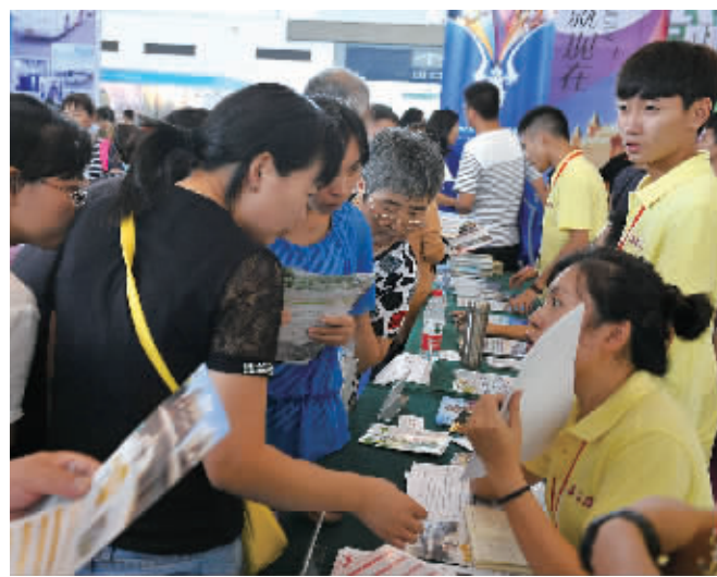
宁波国际旅游展现场。