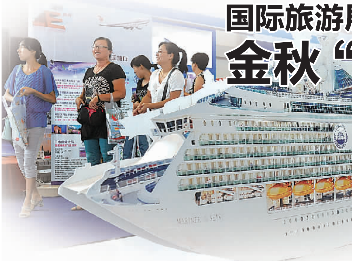
宁波国际旅游展现场。

刚刚落幕的2014宁波国际旅游展,是今年宁波旅游节的重要活动之一。展会上,“淘金”的网民、网友络绎不绝。短短三天时间,就有7万余人次参展,成交金额超过千万元。有别于以往旅游主题展会的形象展示,今年的旅展直接采用B2C模式(Business-to-Customer),构建了购销互动、现场交易的一站式交易平台。“1元景区门票”、“39元一日游”、“买一送一”……几十家旅行社重磅推出了百款金秋旅游产品。