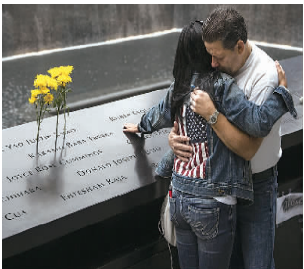
9月11日,“9·11”事件遇难者亲属在美国纽约世贸中心遗址拥抱。

纽约当天也举行一系列民间纪念活动,在各地活动中规模最大。人们在世贸中心“9·11”纪念馆献花、默哀,并由遇难者家属诵读遇难者的名字。