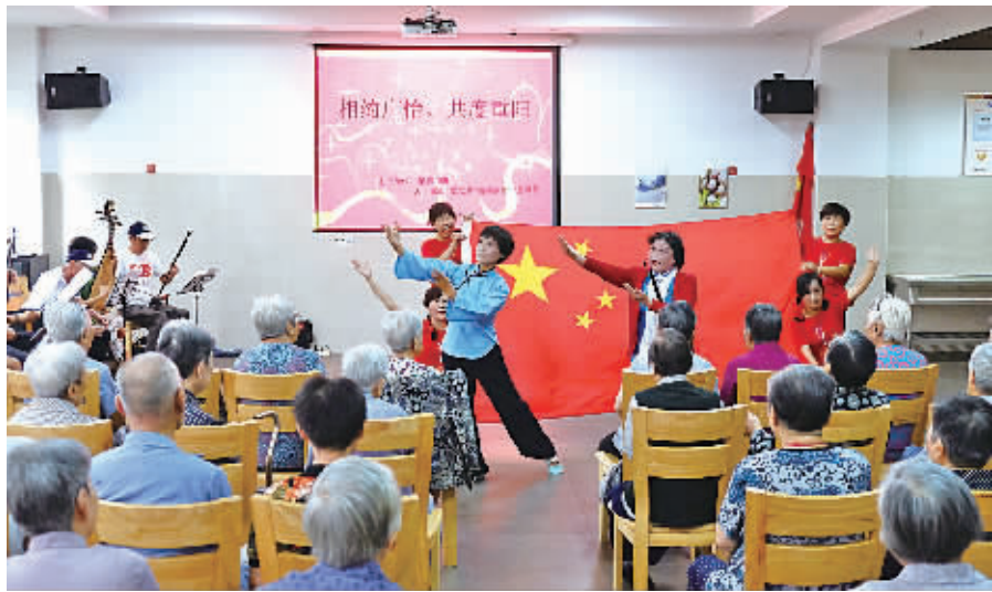
艺术团在表演。

本报讯(记者黄丽娟 通讯员毛一波)“哎……山也笑水也笑,你看祖国大地满园春,形势无限好哇……”9月10日下午,在海曙区广安养老院里音乐悠扬,笑声连连,“天一快活林”艺术团的50多名“演员”为老人们送上了11个歌