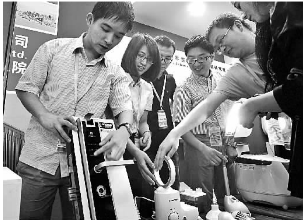
由甲骨文和宁波中科院信息研究院共同打造的“智能家电物联网创新云平台”，是本届智博会的项目成果之一。图为永发集团工作人员在介绍物联网智能锁如何依托云平台运作。