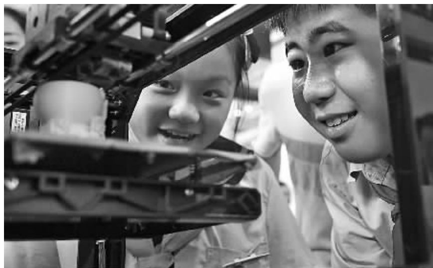
在智博会智慧教育展区，宁波实验小学“小小创客”正向参观者们展示 3D 打印机的的工作原理。

据悉，在前三届智博会上，已经有 62 个项目落户宁波，总金额超过 280 亿元。中兴通讯、东软、中软、浪潮、神州数码、IBM、敦煌网、中搜等一大批国内外知名企业已经顺利落户。这些大型企业、平台型企业的落户，对带动我市云计算、物联网、电子商务、信息服务等产业的发展，打造我市智慧健康、智慧物流、智慧交通等领域的产业生态有着积极的意义。