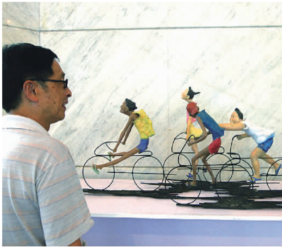
昨天,市民在观看雕塑展。