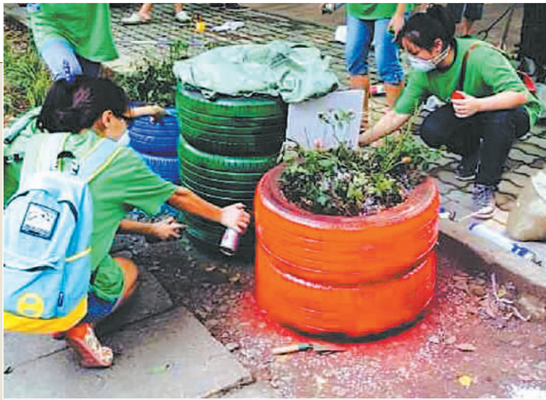
我市某咖啡企业的志愿者日前来到江东丹凤社区开展公益绿色服务活动。环保志愿者利用废旧的汽车轮胎现场制作“狗便便小屋”,既美观又实用。