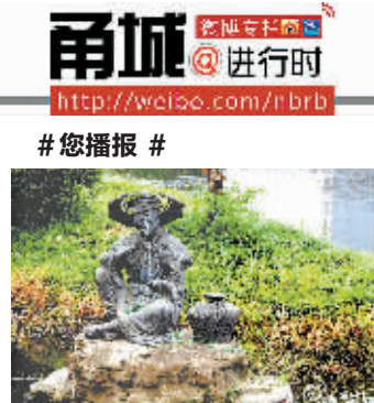
“常乐老兵”:“老爷爷为什么哭了?”小女孩指着月湖中的渔翁塑像问。顺着小手指的方向我看到渔翁泪流满面,身上也湿了,周边撒满了啤酒瓶碎片。我仿佛听到渔翁在诉说:“不文明的游人先卸了我的鱼竿,又砸我的脸。”太不应该了,美好的家园还靠大家爱护。

开发设计独具藏书文化的旅游产品。“未来更注重应用和感知,将我们海曙区‘国中文化资源’拓展到一个国学研修展示体系,从静态观摩转变为动态参与体验,将枯燥的人文历史符号转化为符合旅游特点的活动、装置、展陈、授课等一系列具体的形式。”据悉,这些形式和载体既能满足到此一游的扫描式游客,更针对度假式、深度游客调节身心和感悟生活的需求,把中外游客引得来,留得住。