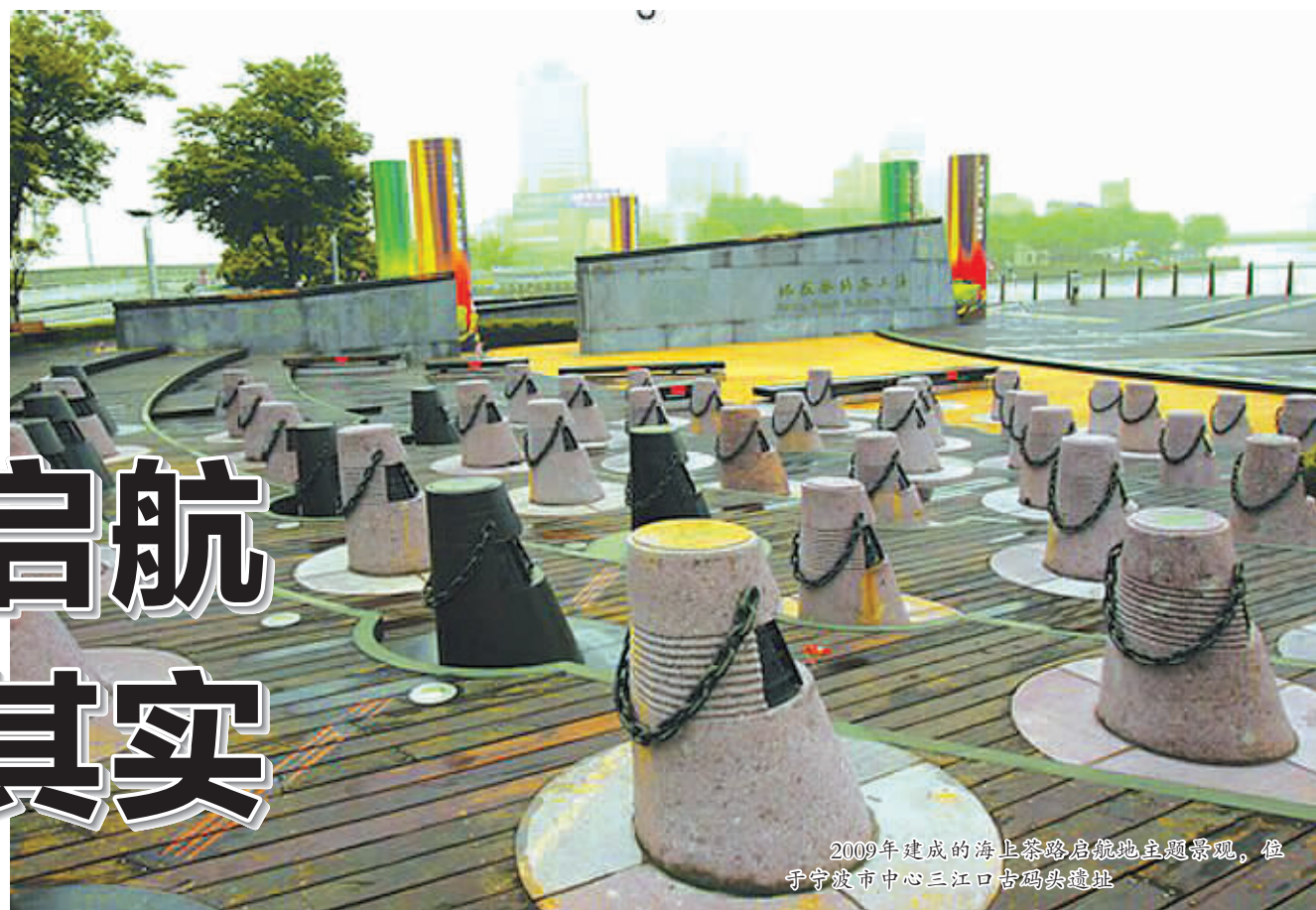
2009年建成的海上茶路启航地主题景观，位于宁波市三江口古码头遗址

2007年-2013年，宁波茶文化促进会、宁波东亚茶文化研究中心先后四次召开“海上茶路·甬为茶港”国际研讨会。海内外专家、学者，一致公认宁波为“海上茶路”启航地，并于2013年通过了《“海上茶路·甬为茶港”研讨会共识》。