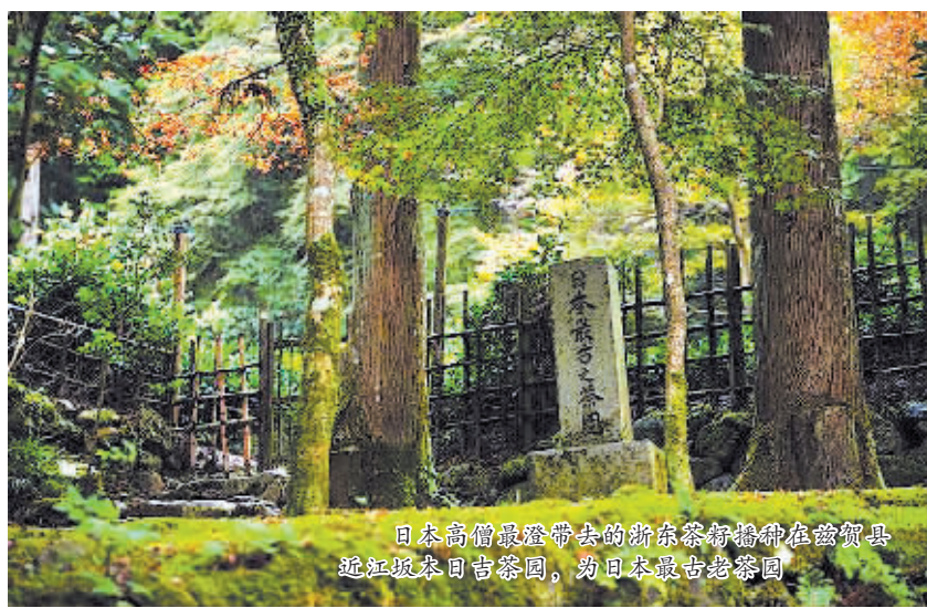
日本高僧最澄带来的浙东茶籽种植在德化县近江坂春日吉茶园，为日本最古茶园

茶叶、瓷器(包括茶具)是“海上丝路”的主要商品，因此，“海上茶路”是“海上丝路”的重要组成部分。