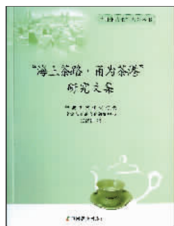
2014年4月出版的《海上茶路·甬为茶港》研究文集