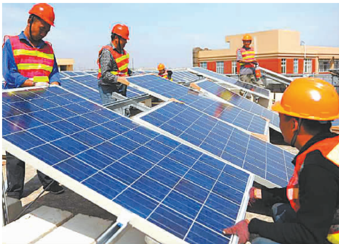
中洲光伏电站并网验收现场。