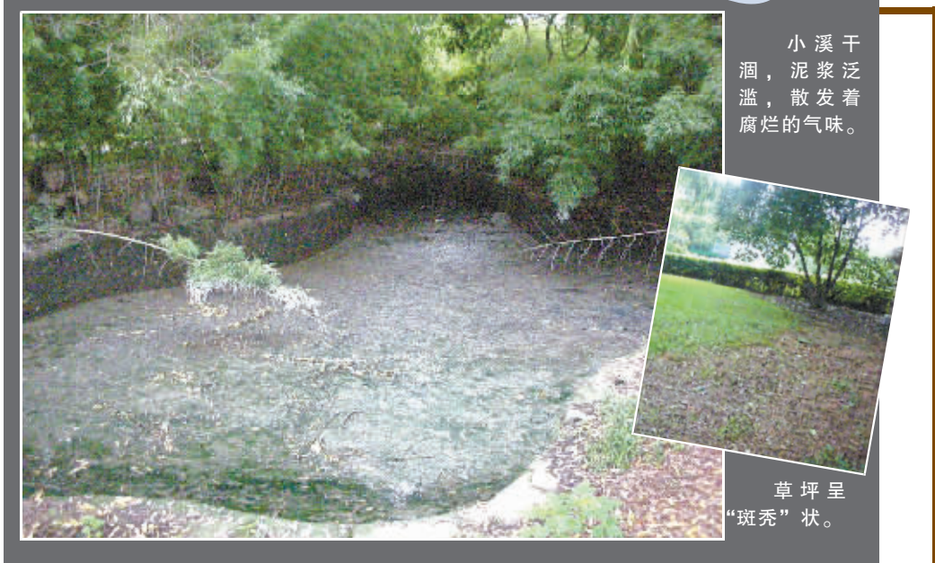
小溪干涸，泥浆泛滥，散发着腐烂的气味。