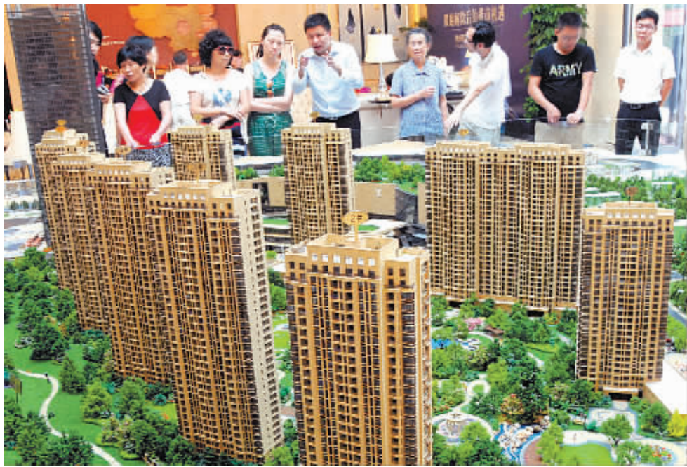
9月18日,国家统计局公布了8月70个大中城市房价数据,其中杭州以环比下降2.1%,同比下降5.6%,位居70个大中城市跌幅首位。

在楼市“金九银十”的传统销售旺季来临之际,市场仍未摆脱交易疲软的尴尬。中原地产数据显示,楼市“金九”开局平淡,中秋假期期间,上海一手商品住宅市场成交