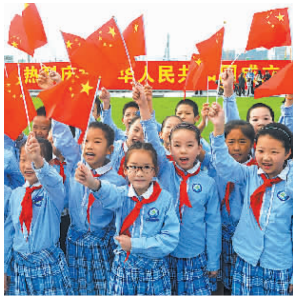
昨天上午,宁波市行政中心南广场隆重举行升国旗仪式。