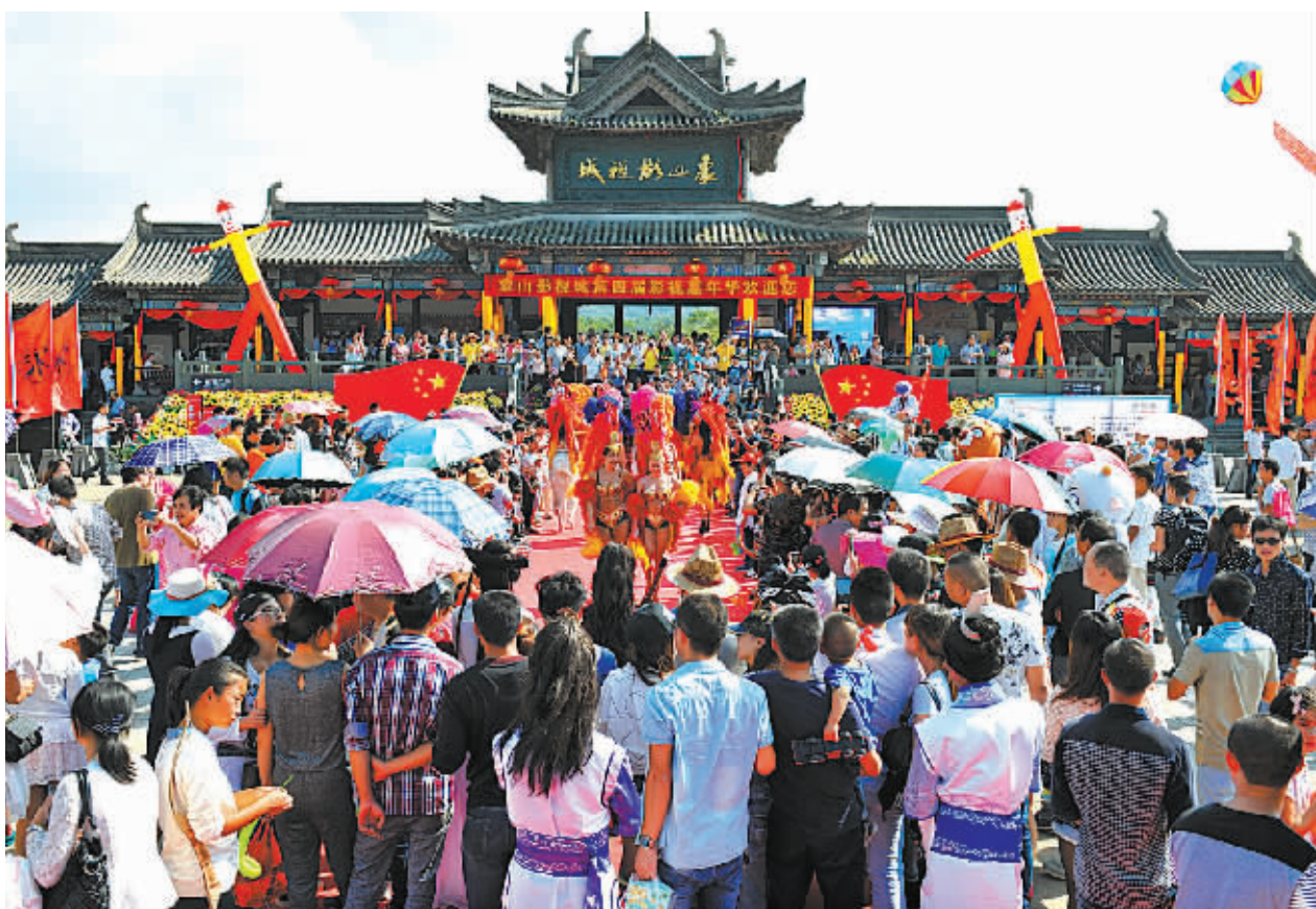
昨日下午,游客在象山影视城观看表演。

来自市旅游局的信息表明,昨日各景区游览状况井然有序,全市未发生一起旅游安全事故。