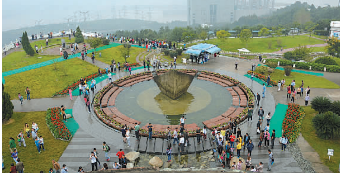
今年国庆长假是三峡大坝旅游区对中国游客实行门票免费新规定后的第一个长假。据长江三峡旅游发展有限责任公司的统计数据，截至10月1日中午12时，三峡大坝旅游区入园游客总数已突破1.1万人次，创同比新高。预计首日游客总量可突破两万人次。图为游客昨天在三峡大坝旅游景点游览。