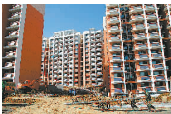
10月1日，工人在南京一在建住宅楼工地施工。