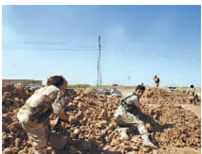
9月30日，在伊拉克北部城市基尔库克附近的村镇，库尔德武装与“伊斯兰国”武装分子作战。

据新华社巴格达9月30日电 (记者陈序 尚乐) 伊拉克安全部门消息人士30日说，伊拉克库尔德武装当天夺回被“伊斯兰国”极端组织控制的伊叙边境重镇拉比耶，打死40多名极端分子。