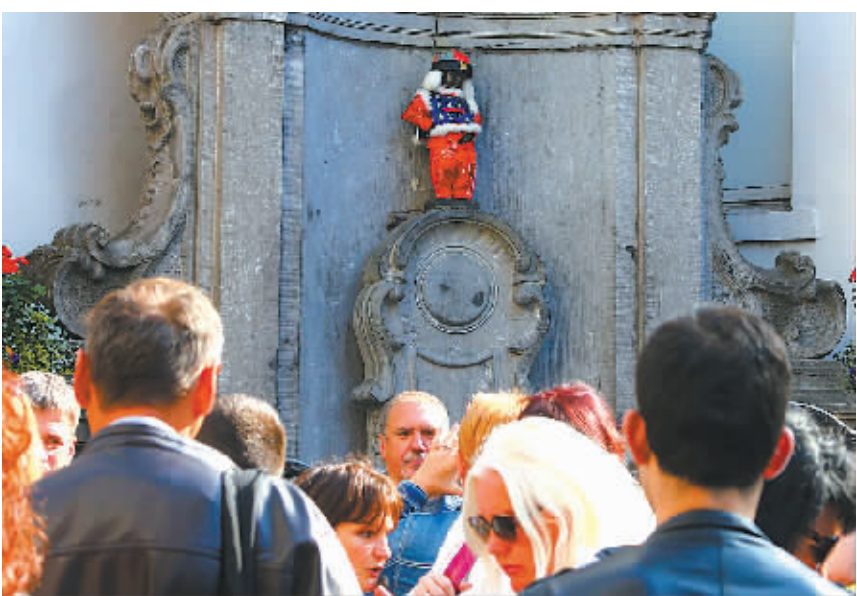
10月1日，在比利时首都布鲁塞尔，游客们在小尿童雕塑前参观。10月1日是中国国庆节，有布鲁塞尔“第一公民”之称的小尿童身着唐装与游人见面。