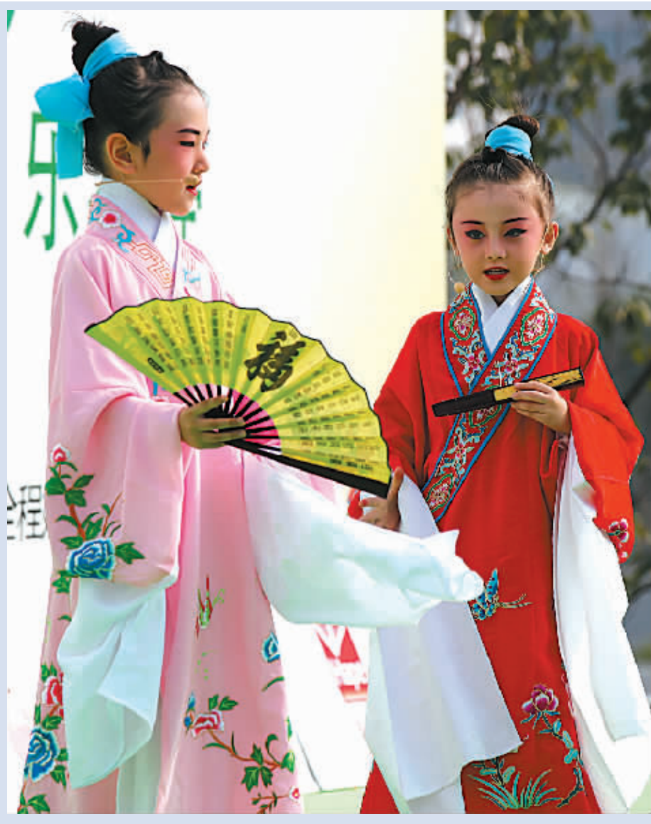
文化广场舞秀才艺

“司法实践中,‘财产问题’剪不断、理还乱’,这不仅成为老人再婚的障碍,而且不少再婚老人最终因财产问题而离婚。办理婚前财产公证,打消再婚老人彼此及子女的疑虑,对于保障双方合法权益、促进家庭和谐具有重要意义。”法官说,同时立遗嘱也是不错的选择,需要提醒的是,法院受理的继承案件中,绝大部分是再婚家庭。因此,立遗嘱一定要合乎规范,最好是采取公证遗嘱的形式,即遗嘱人按照法律规定对其遗产作出处分,并经公证机关公证。