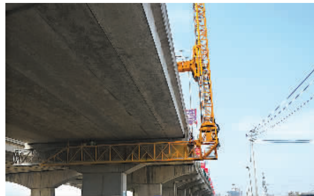
图为高科技桥梁检测仪。

本报讯(通讯员刘健杰 记者包凌雁)日前,南外环福庆路跨线桥上停着一辆大家伙,远远望去颇有点导弹发射车的感觉。现场工作人员说,亏得有了这台大家伙,当天的桥梁检测才能如此快速、全面。