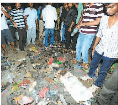
据印度媒体报道,印度比哈尔邦省舍巴特那3日晚发生严重踩踏事故,目前已造成32人死亡,多人受伤。图为在事故现场拍摄的散落的鞋子。