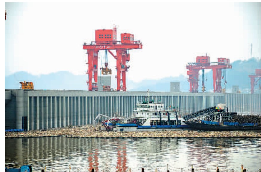
10月4日,清漂船只在三峡大坝坝前清漂。国庆长假期间,处于新一轮175米试验性蓄水的三峡库区多处出现